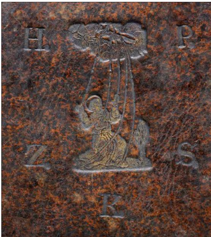
Ryc. 2. „H[elena] P[rażmowska] Z[akonnica] S[więtej] K[lary]” – superekslibris siostry Heleny Prażmowskiej (ca 1718) umieszczony na górnej okładce książki podarowanej norbertankom w Imbramowicach. BUW, sygn. Sd.713.2416.