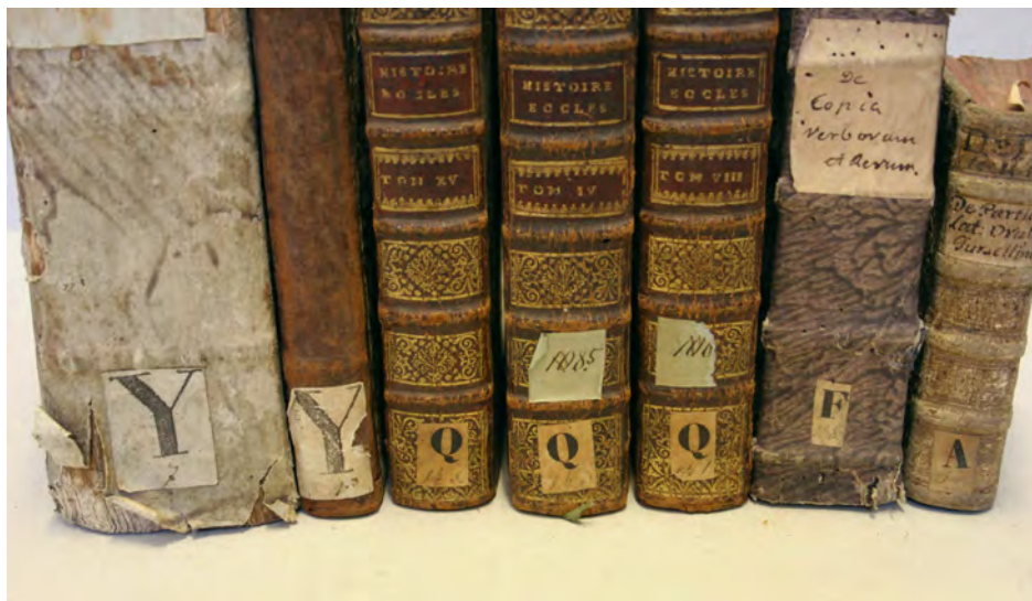
Ryc. 1. Wybrane charakterystyczne grzbiety książek należących do biblioteki kolegium pijarów w Radomiu.