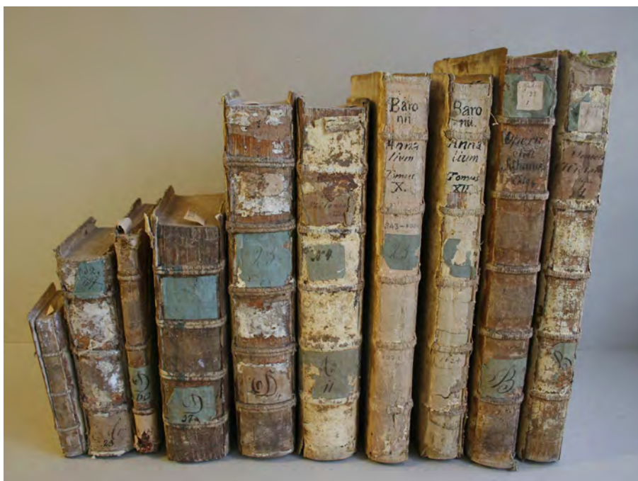
Ryc. 2. Wybrane charakterystyczne grzbiety książek należących do biblioteki klasztoru dominikanów św. Jakuba w Sandomierzu.