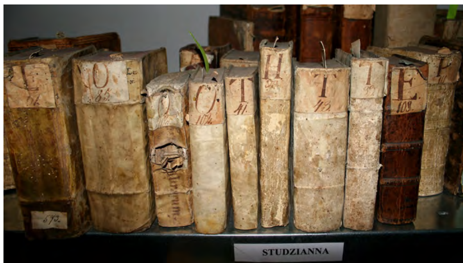
Ryc. 4. Wybrane charakterystyczne grzbiety książek należących do biblioteki kongregacji filipinów w Studziannej.