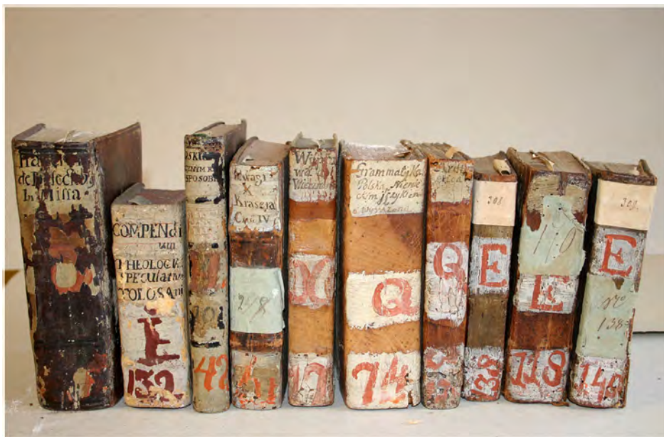
Ryc. 3. Wybrane charakterystyczne grzbiety książek należących do biblioteki klasztoru reformatów w Solcu.