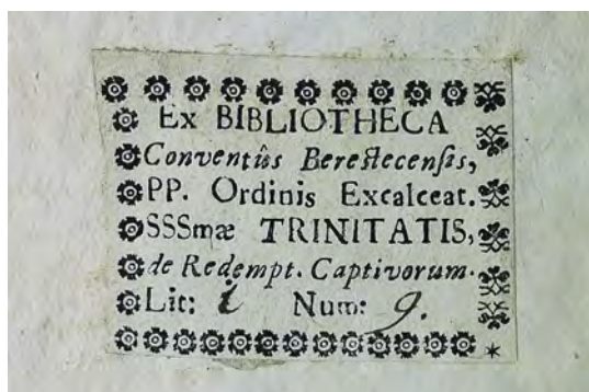
Ryc. 5. Ekslibris biblioteki klasztoru trynitarzy w Beresteczku na druku PIOTR Z POZNANIA, Splendores hierarchiae politicae et ecclesiae a caelesti hierarchia exemplati et ad Christianum regimen atq. ad stabilem republicae permanentiam accommodati... , Lvblini 1654, sygn. SD II 3122.