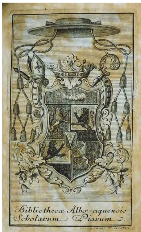
Ryc. 4. Ekslibris biblioteki kolegium pijarów w Białej Wodzie na druku Römischer Katechismus: auf Befehl Sr. Päbstlichen Heiligkeit Pius des V. für die Seelsorger herausgegeben , Wienn 1763, sygn. SD I 683/3.