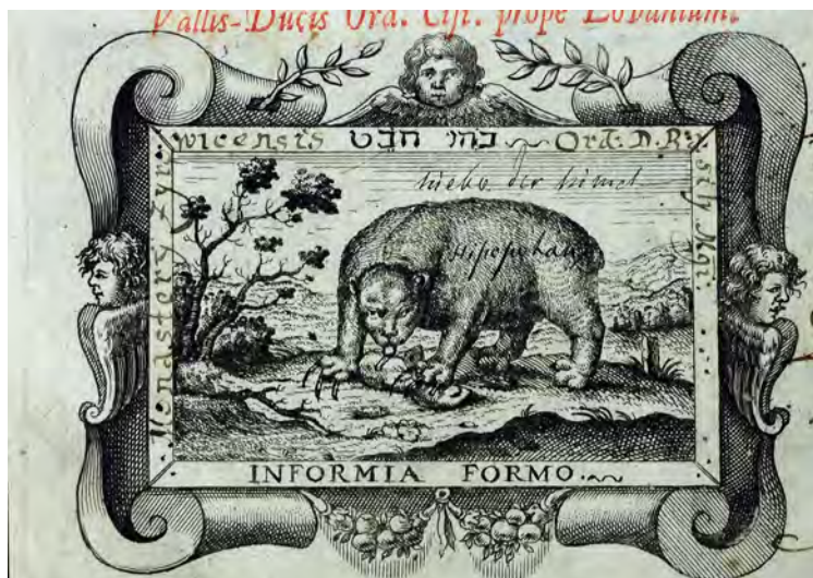
Ryc. 1. Wkomponowany w sygnet drukarski zapis proveniencyjny klasztoru bazylianów w Żyrowicach na druku Jacob ZEGERS, Conceptvs morales svpra dominicas: patre labore genitos, matre sapientia natos, calamo obstetricae svsseptos , Lovanii 1645, sygn. CL II 11010.

Na uzyskane wyniki może mieć wpływ różnorodny charakter badanych księgozbiorów, sposób i cel ich gromadzenia. Głębsza analiza wyników badań proveniencyjnych prowadzonych w księgozbiorach historycznych Książnicy Cieszyńskiej będzie możliwa po zakończeniu wszystkich etapów kwerendy.