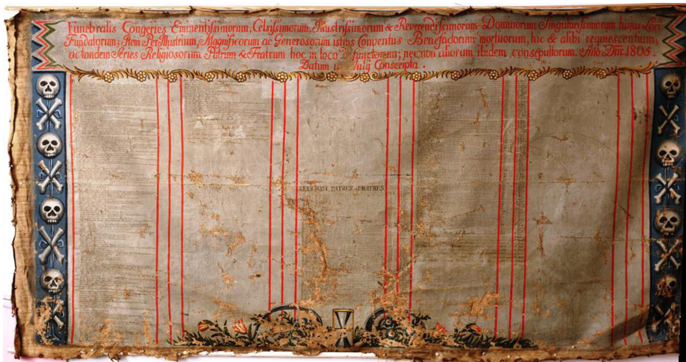
Ryc. 1. AP Olsztyn, Funebralis Congeries . Fot. K. MACIEJKO