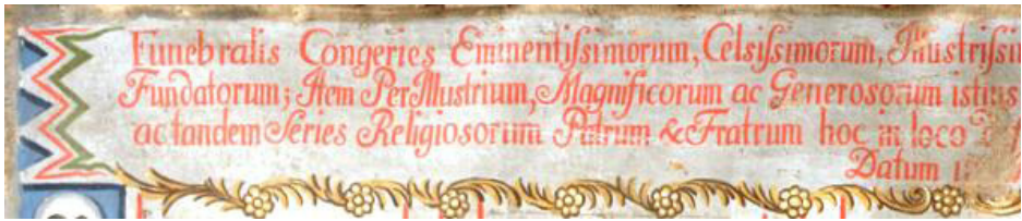
Ryc. 2. AP Olsztyn, Funerabilis Congeries , tytuł.

Wraz z przejęciem malowidła stwierdzono konieczność jego konserwacji 9 . W tym celu bernardyńskie płótno nawinięto na tekturowy wał i przekazano do Centralnego Laboratorium Konserwacji Archiwaliów w Archiwum Głównym Akt Dawnych w Warszawie, ponieważ w owym czasie olsztyńskie archiwum nie posiadało odpowiedniej pracowni. Obiekt przeleżał w Warszawie do lat 90. i bez próby podjęcia prac konserwatorskich został zwrócony do Olsztyna. Od tego czasu był przechowywany w pracowni konserwacji archiwaliów w formie rozwieszony 10 . Obecnie procedura konserwacji jest w toku, zakończenie prac planuje się na koniec 2013 r.