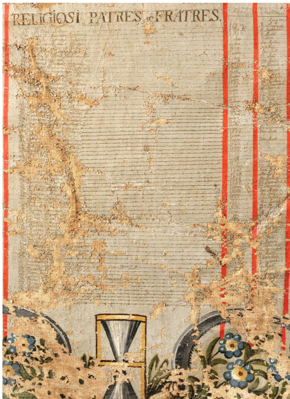
Ryc. 4. AP Olsztyn, Funebris Congeries , spis zmarłych ojców i braci w kolumnie trzeciej.