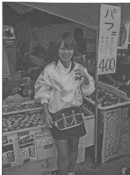
Fot. 3. Młoda Japonka, fot. M. Przybyło, 2004