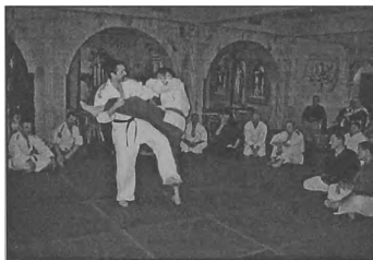
Fot. 4. Prezentacja stylu idōkan yōshin-ryū.