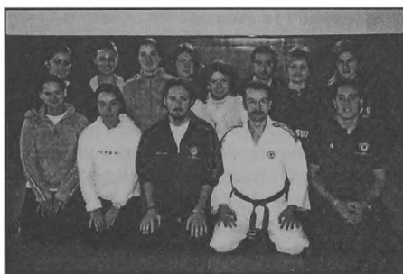
Fot. 6. Sensei Cynarski z grupą studentów – L'Aquila 2004

Dr W. J. Cynarski (6 dan) przeprowadził w dniach 7–14.11.2004 wykłady o socjologii ds w ćwiczenia praktyczne na tatami na Wydziale Nauk o Motoryczności i Sporcie Uniwersytetu w L'Aquila. Pokazał, jakie elementy jūjutsu i karate można włączyć do szkolnego wychowania fizycznego. W tej praktycznej części seminarium uczestniczyli studenci ćwiczący jūdō , różne style karate ( wadō-ryū, shōtōkan ) i kung-fu ( shaolin, ving tsun, taiji ). Na specjalne życzenie wykonał pokazową walkę i demonstrację mistrzowskiego kata stylu zendō karate tai-te-tao (san-