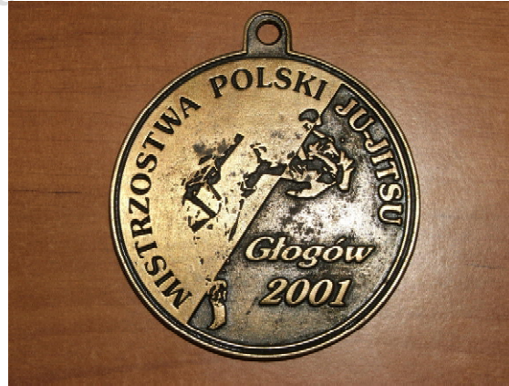
Fot. 11–12. Awers i rewers medalu MP w Głogowie / Photo 11–12. Averse & reverse of the NC medal Głogów 2001