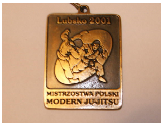
Fot. 10. Medal MP Lubsko 2001 / Photo 10. Medal of National Championships in Lubsko 2001

Fot. 10–12 pokazują medale przygotowane specjalnie na turnieje w Lubsku i Głogowie. Wprawdzie organizacja pn. Międzynarodowa Federacja Modern Ju-Jitsu z Głogowa (prezentująca swoje logo obok logo PZJJ na medalu mistrzostw, fot. 12) ustaliła przepisy tzw. modern ju-jitsu, które są formułą mieszającą zasady jūjutsu i kyokushin karate , ale pokazanie na obydwu medalach scen wziętych wprost z kyokushin karate jest już pewną przesadą (fot. 10 i 12).