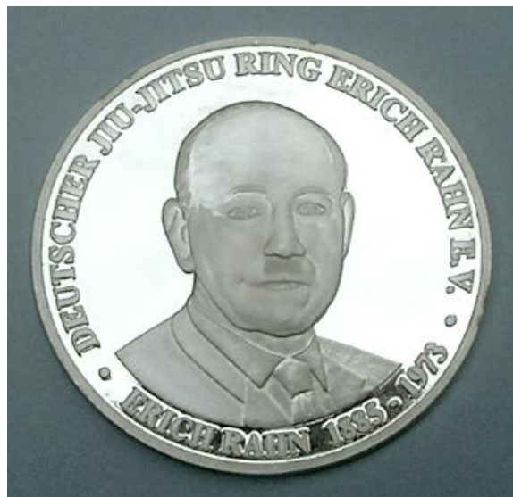
Fot. 3. Order Rycerski Fujiyama / Photo 3. Order of Fujiyama Knight Fot. 4. Medal Pamiątkowy Ericha Rahna / Photo 4. The Erich Rahn Commemorative Medal

W 2006 roku DJJR „Erich Rahn” e.V. powołało Medal Pamiątkowy Ericha Rahna ( die Erich Rahn Gadenkmedaille ) i w tym też roku 6 takich medali zostało przyznanych zasłużonym instruktorom i działaczom tego najstarszego niemieckiego stowarzyszenia praktyków azjatyckich sztuk walki – podczas jubileuszu 100-lecia berlińskiej szkoły E. Rahna. Wybito je w srebrze, stemplem lustrzanym (fot. 4).