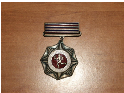
Fot. 14. Odznaka resortowa za zasługi w kulturze fizycznej / Photo 14. Ministerial award of merit in physical culture

Odznaki pierwszego typu są sprzedawanymi lub rozdawanymi dla reklamy i promocji gadżetami. Bardziej wartościowe są odznaki drugiego rodzaju, jako rzadziej uzyskiwane. Szczególną jednak wartość posiadają odznaki kategorii 3 i 4. Przykładem waloru kat. 3 jest „Złota Odznaka PZJJ”, najwyższe odznaczenie Polskiego Związku Ju-Jitsu. Z racji niewielkich rozmiarów (średnica ok. 2 cm) zawiera jedynie centralnie umiejscowione godło Polski, w otoku nazwę związku, to wszystko w kolorze złotym na tle białoczerwonej sakury (kwiat wiśni) i otoczone w ok. 60% wieńcem. Sakura jest tutaj, podobnie jak w jūdō , nawiązującym do kodeksu Bushidō symbolem drogi wojownika. Z kolei odznaka resortowa „Zasłużony Działacz Kultury Fizycznej”, jak ta przyznana obydwu autorom za działalność w Stowarzyszeniu Idōkan Polska (fot. 14), jest dobrym przykładem nagrody i obiektywnego wyrazu uznania za działalność i znaczące dokonania w dziedzinie sztuk walki i – bardziej ogólnie – w kulturze fizycznej. Wyobrażenie biegacza z pochodnią na tymże odznaczeniu nasuwa skojarzenie ze sportem i kulturą fizyczną.