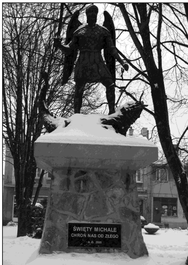
Fot. 1. Pomnik Archanioła Michała w Strzyżowie / Photo 1. Monument of Archangel Michael in Strzyżów

Gerhard Schön [1995] w swym Katalogu monet olimpijskich świata zamieszcza m.in.: