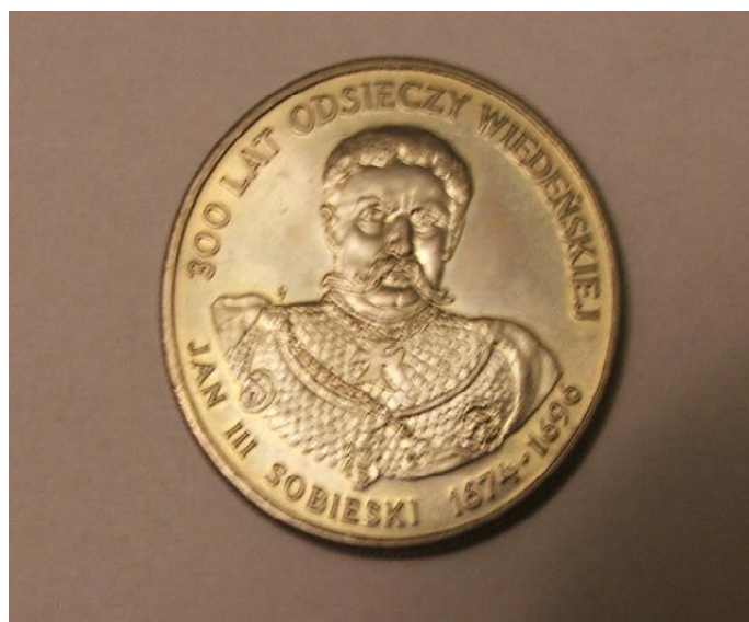
Fot. 2. Król Jan III Sobieski 1674–1696, 50 zł, „300 lat Odsieczy Wiedeńskiej” / Photo 2. King Jan III Sobieski, 50 zloty, „300th anniversary of the of Vienna”

Ogólnie możemy tu wyróżnić kilka kategorii, a mianowicie: 1) waleczni władcy i przywódcy, bohaterowie, jak: Mieszko I, Bolesław Chrobry, Stefan Batory, Jan III Sobieski, Józef Piłsudski, w tym bohaterowie Polski i USA – T. Kościuszko i K. Pułaski 4 ; 2) twórcy i postaci literackiej tradycji – jak H. Sienkiewicz i Jerzy Michał Wołodyjowski, niepokonany nigdy mistrz szabli i rycerz bez skazy; 3) bohaterstwo wojenne i bohaterowie, jak polscy żołnierze września 1939, major Henryk Dobrzański „Hubal”, oraz poświęcony im Order Virtuti Militari; 4) fortyfikacje – od Malborka po Zbaraż lub Kamieniec Podolski (na monecie z poz. 19 w zestawieniu). Szlachetne kruszce podkreślają znaczenie danej postaci, rocznicy wydarzenia itp.