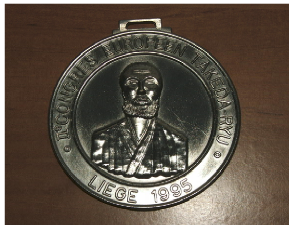
Fot. 5. Medal jubileuszu 30-lecia na drodze sztuk walki / Photo 5. Medal of jubilee 30 years on the martial arts' way