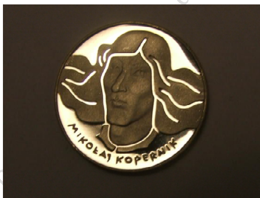
Fot. 7. Rewers monety 100 zł z podobizną Mikołaja Kopernika (1973) / Photo 7. Reverse of the coin 100 zloty with Nicholas Copernicus