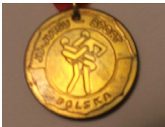
Fot. 9. Złoty medal Mistrzostw Polski w jūjutsu 1994 (rewers). Awers przedstawia godło Polski i w otoku napis „Mistrzostwa Polski” / Photo 9. Gold medal of Polish Championships in ju-jitsu 1994 (reverse). Averse shows emblem of Poland and inscription: „Mistrzostwa Polski” (Polish Championships)