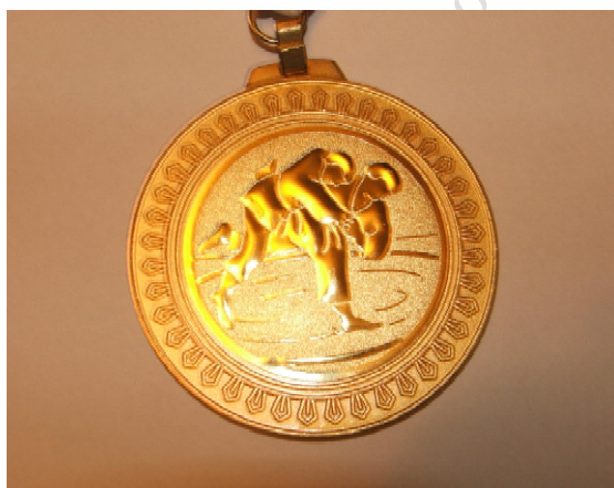
Fot. 8. Złoty medal jūdō / Photo 8. Gold medal in judo