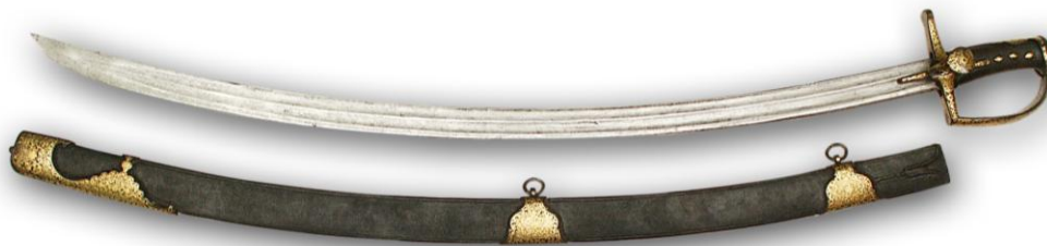
Fot. 4. Szabla husarska – Polska, XVII w. / Photo 4. The hussar sabre – Poland, 17 th c.

Kasztelan Zygmunt Kwiatkowski organizuje od roku 1977 na zamku w Golubiu-Dobrzyniu międzynarodowe Turnieje Rycerskie, będące swoistymi wielobojami konkurencji konnych z bronią (kopia, miecz). Nagrodą dla najlepszego jest Pierścień Kmicica [Dryszel 2001]. Podobne międzynarodowe turnieje organizowane są od 12 lat na zamku w Dębnie, gdzie rycerze rywalizują o „złoty warkocz Tarłówny” [Kowalski 2006]. Naśladowcy rycerzy trenują w swych bractwach lub – dla osiągnięcia wyższego poziomu i wierności wobec oryginalnej tradycji – w szkołach sztuk walki. Takich ważniejszych szkół polskich sztuk walki jest dwie.