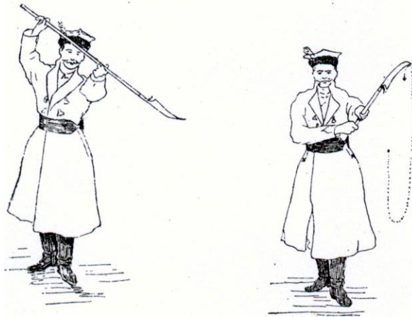
Ryc. 2. Ćwiczenia obrazowe kosą. Obraz I, figury 3 i 4 / Fig. 2. Pictorial exercises with scythe. Picture I, figures 3 and 4