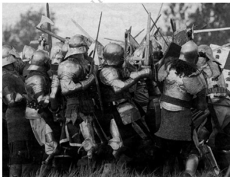
Fot. 3. Bitwa pod Grunwaldem – coroczna inscenizacja [Woj 2005] / Photo 3. The battle of Grunwald – annual stage adaptation.

Osobą wielce zaangażowaną w restaurację polskich i europejskich sztuk walki jest Tadeusz Pagiński – fechtmistrz i twórca sukcesów polskiego floretu kobiet. Jest on mistrzem Gdańskiej Szkoły Fechtunku św. Jerzego i hetmanem Kapituły Rycerstwa Polskiego. Pod ową Kapitułę podlega większość bractw rycerskich. Według spisu bractw rycerskich działa ich w Polsce aktualnie 37 [Sawicki 2005]. Organizowane z udziałem owych bractw inscenizacje bitew pod Cedynią (972) lub pod Grunwaldem (1410), gdzie liczba widzów dochodzi do 100 tysięcy, są żywymi lekcjami historii [fot. 3].