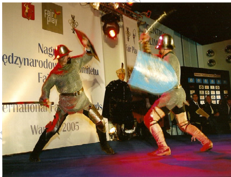
Fot. 8. Pokazowa walka z użyciem średniowiecznych mieczy i tarcz / Photo 8. Show combat with the use of medieval swords and shields

Realizowane tu studia narodowych sztuk walki dotyczą okresów historycznych, np. technik walki z czasów Mieszka I (walka włócznią o długości do 2 metrów – piesza i konna, rzucanie włócznią i oszczepem, walka mieczem jednoręcznym – piesza [fot. 8] i konna, użycie jednoczesne tarczy i miecza, lub włóczni, oszczepu, topora, walka z użyciem samej tarczy – piesza i konna, strzelanie z łuku, walka maczugą, chwytywanie na lasso, walka piesza przy użyciu noży i proc).