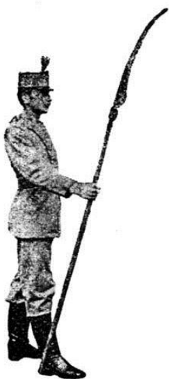
Ryc. 1. Komenda „spocznij” [Sikorski 1911; Regulamin ćwiczeń kosą , Lwów 1913] / Fig. 1. The command “at ease!” [Sikorski 1911; Regulations of exercises with scythe , Lvov 1913]

Kosa bojowa stanowiła oręż polskich oddziałów chłopskich w powstaniu narodowym nazywanym Insurekcją Kościuszkowską. Polscy kosynierzy zdobyli wówczas rosyjskie armaty w bitwie pod Raclawicami (4 kwietnia 1794 r.). Bohater zwycięskiego ataku w owej wiekopomnej bitwie, Wojciech Bartosz Głowacki z Rzędowic, okrył się sławą, która żyć będzie zawsze w sercach Polaków.