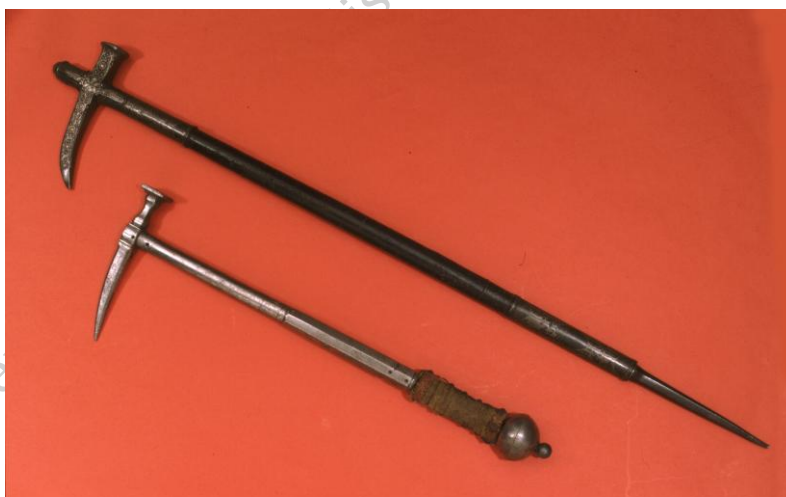
Fot. 2. Nadziaki, Polska – XVII w. / Photo 2. Nadziaks, Poland, 17 th c.