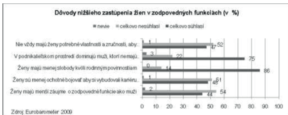
Graf 1. Komparácia počtov riadiacich funkcií v polícii v rokoch 2009 a 2012.

mužského a typicky ženského správania v rôznych sociálnych súvislostiach 9 . Tradičné ponímanie mužských a ženských úloh, nielen v sociologickom výskume, bolo v minulosti podmienené predovšetkým biologicky, čím sa samozrejme nepopiera diferenciácia v pohlaviach, výrazne zreteľnejšie sa však zameriava na rod, ktorý predstavuje akýsi sociálny konštrukt, a môže sa vplyvom prostredia či kultúry meniť. Toto rozlíšenie medzi pohlavím a rodom prináša nové východiská pre skúmanie danej problematiky, nakoľko v minulosti boli ženy automaticky označené nižším sociálnym statusom, práve a len vďaka svojej príslušnosti k pohlaviu, a z toho vyplývajúceho biologického determinizmu. Z tohto dôvodu narážajú ambiciózne ženy na tzv. sklený strop - na výkon práce majú všetky predpoklady a zručnosti, ale z dôvodu nerovného postavenia sa na požadované posty nedostávajú. V prípade obsadenia takejto pozície sa považujú za výnimku alebo niečo, čo je v našej spoločnosti skôr raritou. Rovnako sa tu stretávame s pozíciou ženy v úlohe tzv. bielej vrany , kedy je pri výkone práce pod zvýšeným drobnohľadom, pričom sa zdôrazňujú jej nedostatky, kvôli presvedčeniu, že nie je na daný post vhodná, z dôvodu svojej biologickej rozdielnosti 10 .