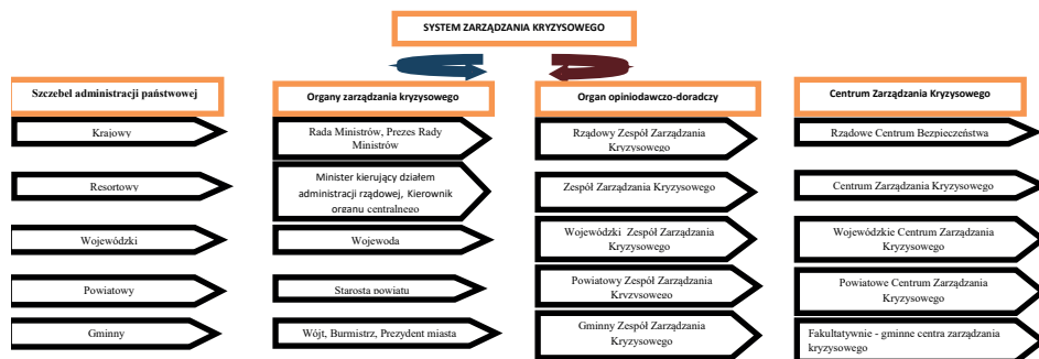
Rys. 2. Szczegółowy system ZK