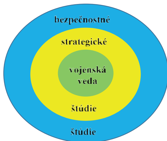
Obrázok 1. Vymedzenie pozície bezpečnostných štúdií, strategických štúdií a vojenskej vedy.