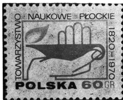
Ryc. 2. Znaczek pocztowy wydany przez Poczta Polską z okazji 150 rocznicy Towarzystwa Naukowego Płockiego, zaprojektowany przez Henryka Chylińskiego

Towarzystwo organizuje sesje naukowe regionalne, ogólnokrajowe, a nawet międzynarodowe. Prowadzi obfitą i poważną działalność wydawniczą; m.in. wydaje od 22 lipca 1956 r. kwartalnik „Notatki Płockie”. Nadal prowadzi Bibliotekę im. Zielińskich (dawne Muzeum TNP, obecne Muzeum Mazowieckie od 9 grudnia 1949 jest już placówką państwową). W dniu swego jubileuszu TNP liczyło 336 członków 3 .