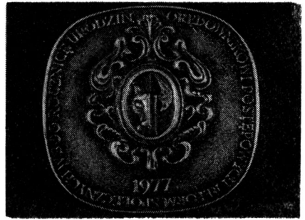
Ryc. 3. Medal Wybity z okazji Sesji w Lesznie: a — awers, b — rewers

staną zapewne umieszczone w wydawnictwach ukazujących się poza Instytutem Historii Nauki, Oświaty i Techniki 2 .