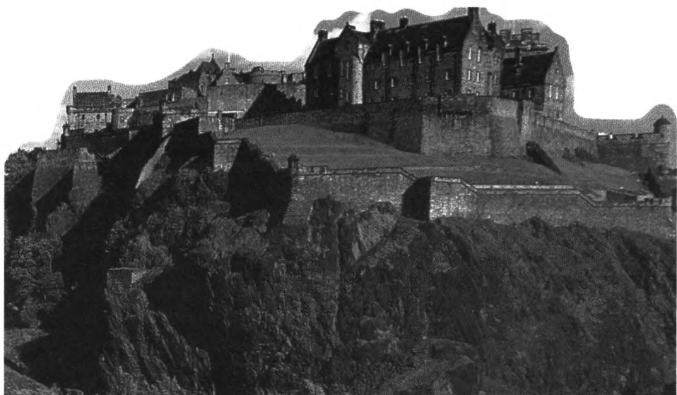
Ryc. 1. Zamek w Edynburgu.