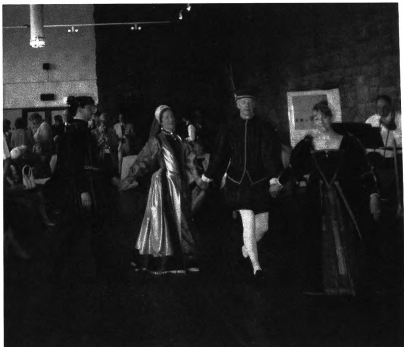
Ryc. 7. Taniec w wykonaniu Edynburskiego Zespołu Muzyki Dawnej.