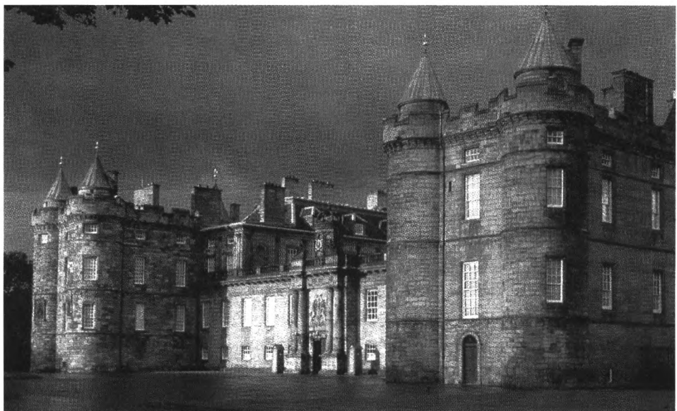
Ryc. 2. Pałac Królewski w Edynburgu.