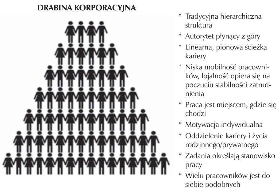
Rysunek 2. Od drabiny korporacyjnej do organizacyjnej pergoli

Przejście od drabiny korporacyjnej do organizacyjnej pergoli zobrazowano na rysunku.