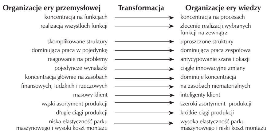
Rysunek 1. Kierunki ewolucji organizacji

Źródło: opracowanie własne na podstawie: Mikula, 2007, s. 26.