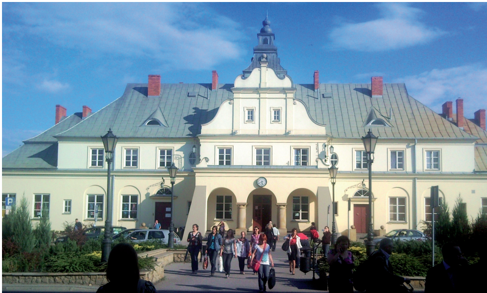
Ryc. 3. Żyrardów, budynek dworca kolejowego