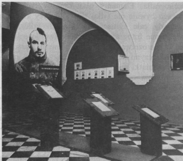
27. Wystawa „Sybir romantyków”. Fragment sali III zatytułowanej „Na Kirgiskich stepach”.

W ekspozycji „Sybir romantyków”, jak i w innych wystawach proponowanych od kilku co najmniej lat przez Muzeum Literatury, odeszliśmy od tradycyjnej prezentacji sylwetek pisarzy wyłącznie poprzez różne archiwalia i pamiątki, książki czy zachowane rękopisy. Ich udział w nich pozostawał zawsze duży, ale w kreowaniu zdarzeń z polskiej historii i kultury, a nie tylko samej literatury, istotną rolę spełnia