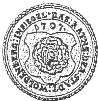
Ryc. 3 Pieczęć rady miejskiej Dobiegniewa z 1707 roku