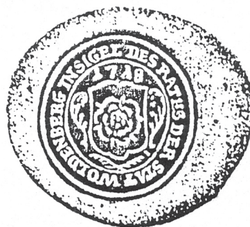
Ryc. 4 Pieczęć rady miejskiej Dobiegniewa z 1718 roku