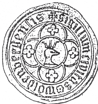
Ryc. 2 Pieczęć Dobiegniewa z ok. 1460 roku