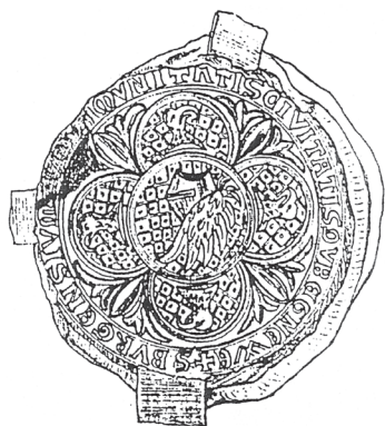
Ryc. 1 Najstarsza pieczęć Dobiegniewa z końca XIV w.