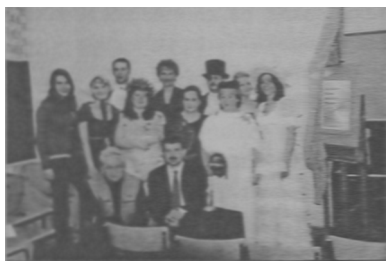
Rys. 9. Zdjęcie grupy wykonawców.

biegu spotkania. Uzyskanie zamierzonego wrażenia estetycznego u odbiorców. Umiejętność tworzenia dokumentacji oraz gromadzenia materiału faktograficznego.