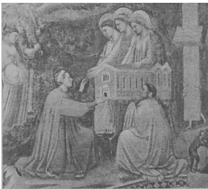
Rys. 3. Giotto, Adoracja króli, fresk 1303-1306.

Muzyka okresu średniowiecza reprezentują chorały gregoriańskie i fragmenty organum, które istniały równolegle z muzyką biesiadną oraz pieśniami pielgrzymów. Architektura tworzy grube mury z surowego kamienia, półkolisty zakończony małe okna biegnące rytmicznie przez całą długość czoła. Półmrok, portale, tympanty, nisze, załomane mury pełne są tajemniczych rzeźbionych w kamieniu postaci i scen z Nowego Testamentu. Poezja musiała być kunsztowna, dobrze skomponowana, rytmiczna, harmonijna i przyjemna dla ucha. Teatr średniowieczny wyrósł z chrześcijańskich obrzędów. Później półmrok romańskich budowl