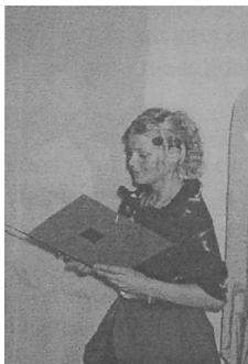
Rys. 5. Prezentacja sztuki Baroku.

Zasadnicza zmiana w europejskiej muzyce Baroku daje początek rozkwitu muzyki instrumentalnej, wirtuozostwa na instrumentach oraz początek opery. Cechą charakterystyczną epoki jest technika basso continuo, będąca przejawem nowych założeń tonalnych opartych na systemie dur – moll. Późny Barok wpada w wybujały emocjonalizm i subiektywizm wypowiedzi artystycznej. W tym okresie następuje rozwój monumentalnego budownictwa kościelnego i świeckiego. Wnętrza bogato rozczłonkowane, często pokrywane malowidłami iluzjonistycznymi. Budowa miast na planie gwiazdy, rozwój architektury ogrodowej. W rzeźbie widoczne zainteresowanie problemami ruchu, dynamiki oraz grą światła i cieni. W malarstwie światłocień służy do wydobycia ekspresji.