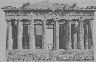
Rys. 2. Partenon. Ateny 447-432r. p.n.e.

W rękach kapłanów skutecznie na niego wpłynęła. Architektura reprezentuje budownictwo z cegły suszonej, później wypalanej.