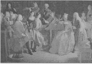
Rys. 6. Michel-Ange Houasse Wieczór muzyczny.

W rzeźbie to głównie postać ludzka naga lub w lekkim stroju. Tematyka malarska oparta na analogiach antyku, rozwój portretu. Kompozycje statyczne posiadają czysty kontur, zgaszony koloryt, miękkie światłocienie i gładką fakturę.