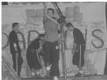
Rys. 3. Break dance – Zespół Conflict Zone