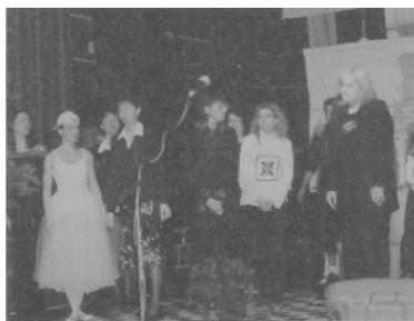
Rys. 6. Autorzy i wykonawcy audycji pt. DARWIN's