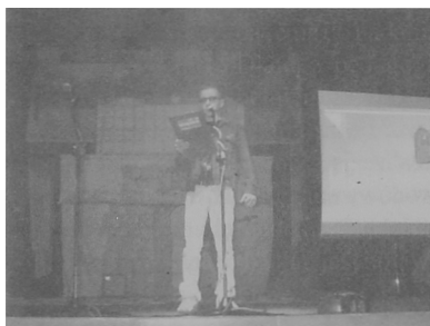
Rys. 5. Rytm, puls i światło w muzyce – K. Schön