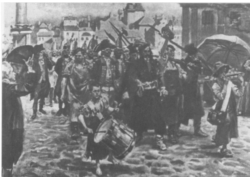
J. Kiliński prowadzi jeńców rosyjskich przez Warszawę