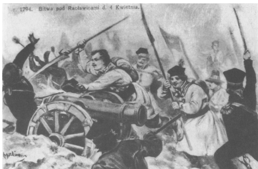
Bitwa pod Racławicami