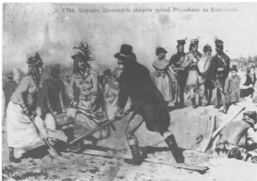
Sypanie okopów obronnych