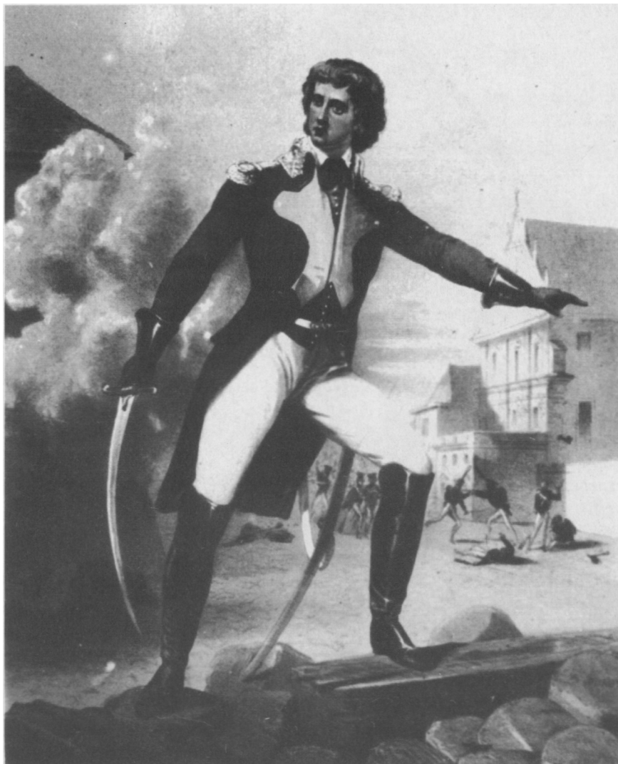
Gen. Jakub Jasiński (1759-1794), poległy bohatersko podczas zdobywania przez wojska rosyjskie Pragi w dniu 4 listopada 1794 r.