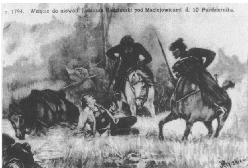
Tadeusz Kościuszko dostaje się do niewoli rosyjskiej pod Maciejowicami