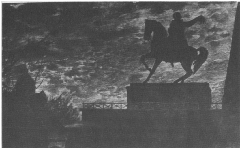
Pomnik Tadeusza Kościuszki na Wawelu