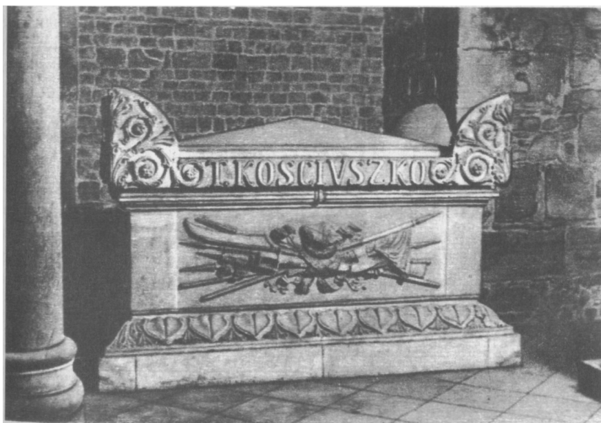
Sarkofag Tadeusza Kościuszki w krypcie na Wawelu