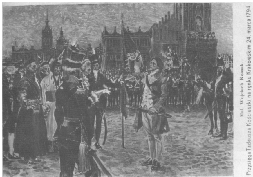
Mal. Wojciech Kosanuk. Przysięga Tadeusza Kościuszki na rynku Krakowskim 24. marca 1794