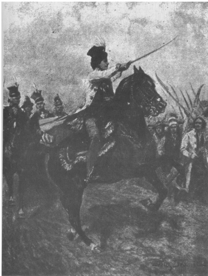
Bitwa pod Racławicami