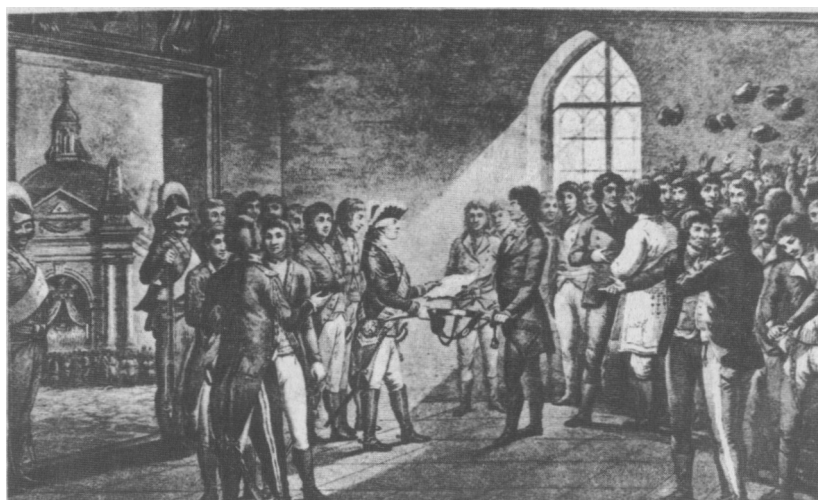
Car Paweł I zwraca Kościuszcze wolność