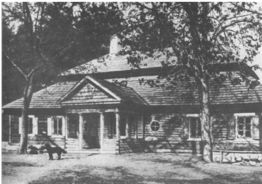
Dworek w Mereczowszczyźnie, miejsce urodzenia Tadeusza Kościuszki (widok obiektu zrekonstruowanego w latach międzywojennych)