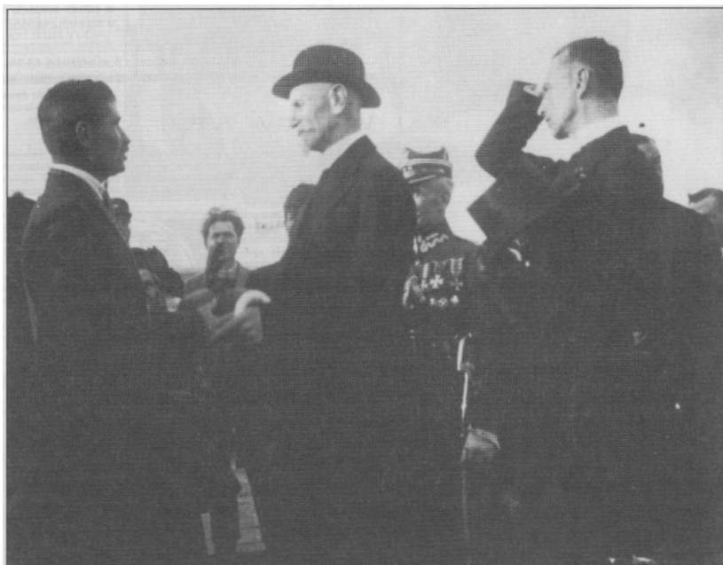
Wizyta Prezydenta RP Stanisława Wojciechowskiego i wojewody nowogródzkiego Władysława Raczkiewicza w Słonimie, 1923.