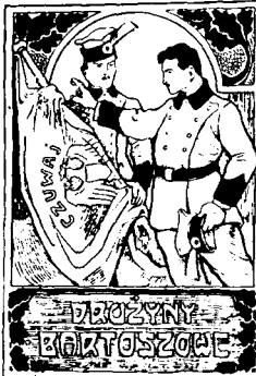
Jednodniówka "Brzuchowice" 12 sierpnia 1934

Wasze czyn to oflara, nasza myśl oklaskiem; myślimy jednako, ale zasługa po Waszej stronie, Drużyniacy Bartoszewi, dźdę Czyno. Witamy Was i dziękujemy Wam niezliczonej falandze Waszych kolegów za królowski dar, za wolną Ojczyznę, za nadzieję, która nas zapewnia, że Polska stanie się małą, kochającą swoje dzieci.