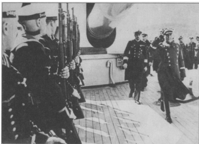
Wizyta gen. Tadeusza Kutrzeby na pancerniku "Schleswig-Holstein" w Bremie, 1935.