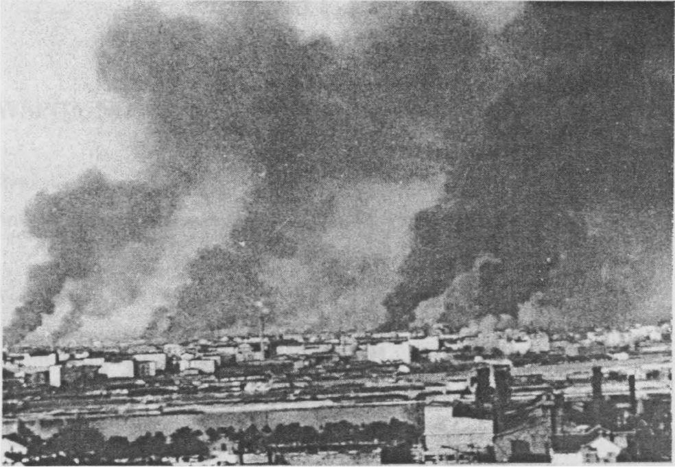
Warszawa płonie, wrzesień 1939 r.