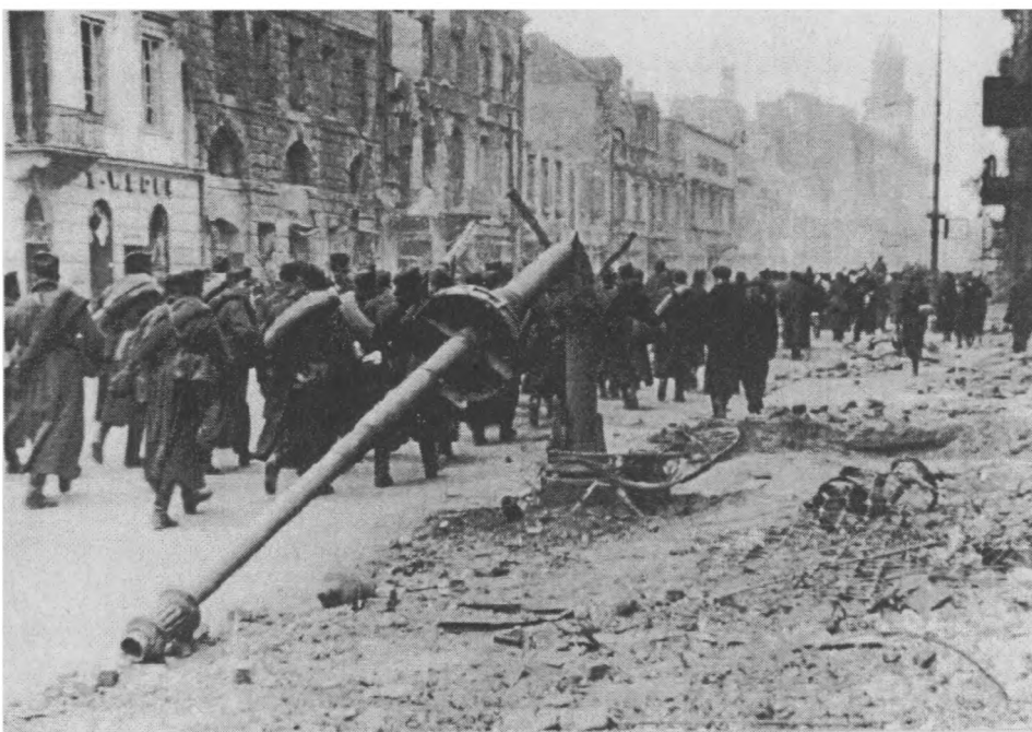
Warszawa zniszczona, wrzesień 1939. Nowy Świat, żołnierze polscy opuszczają stolicę po kapitulacji.