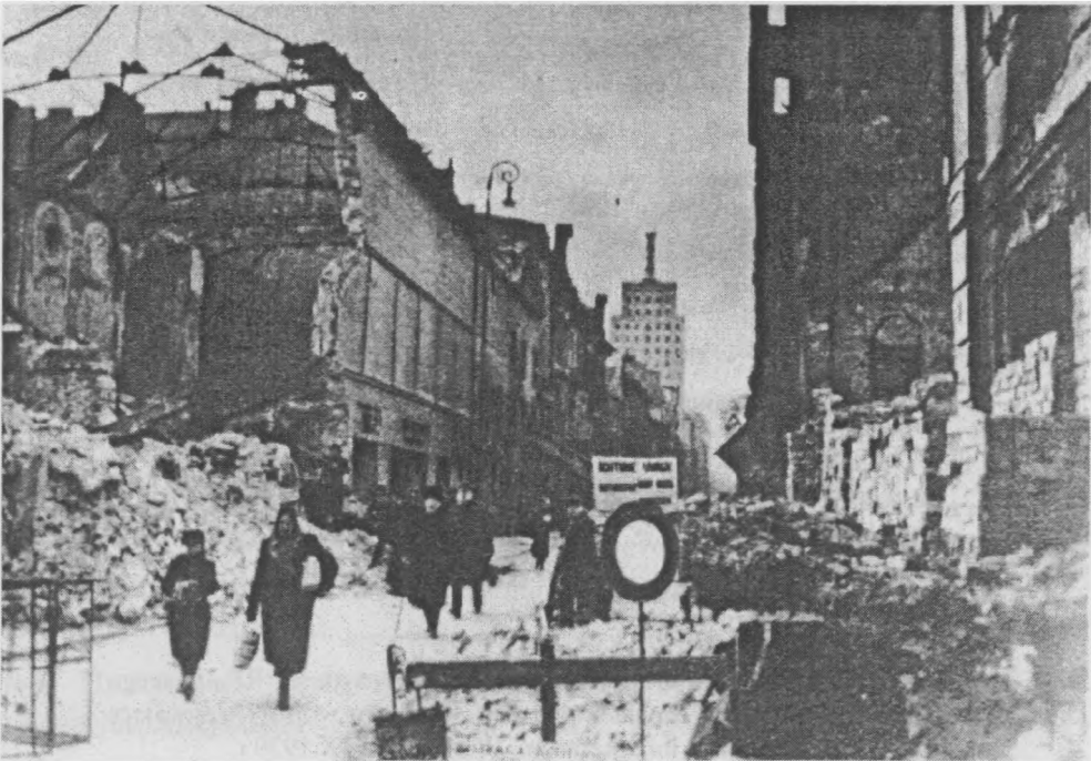
Warszawa, wrzesień 1939 r. ul. Bracka.