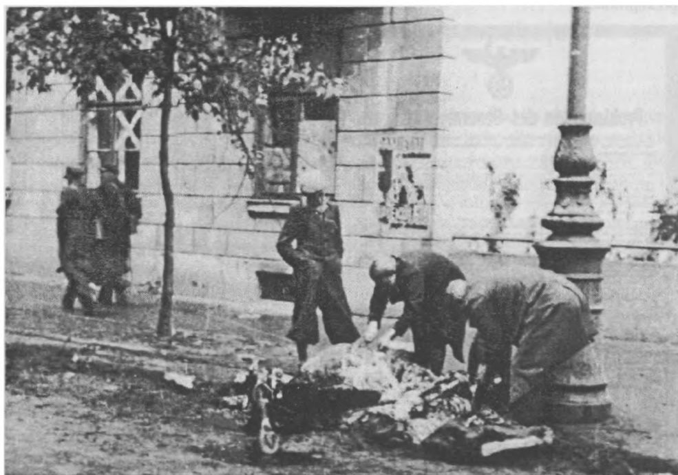
Pochowanie warszawiaka. Ofiara nalotów samolotów hitlerowskich.