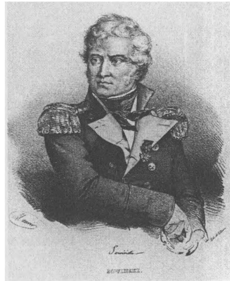
Gen. Józef Sowiński. rys. N.E. Maurin, lit. François de Villain