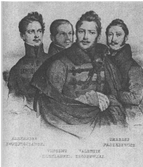
Grupa belwederczyków, rys. Lanta, lit. François de Villain