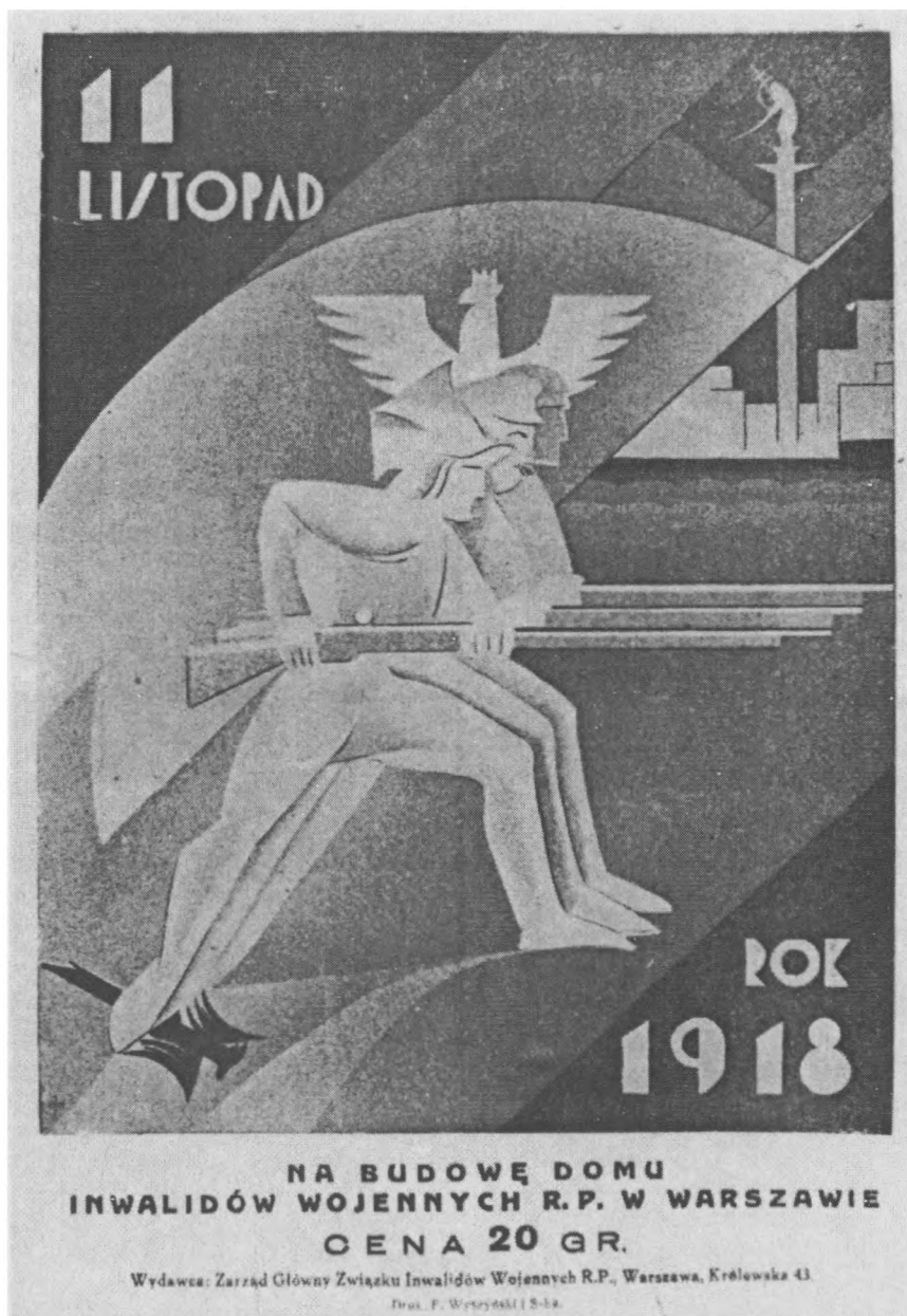
Cegiełka „Na budowę Domu Inwalidów Wojennych w Warszawie”, upamiętniająca czyn niepodległościowy i odzyskanie niepodległości