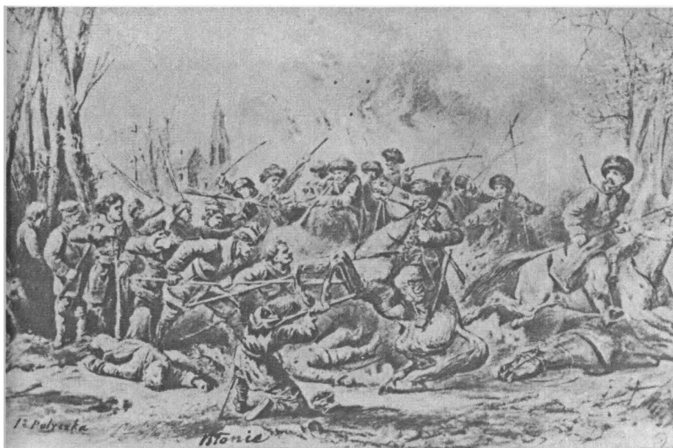
Powstanie styczniowe – bitwa pod Błoniem (rys.)