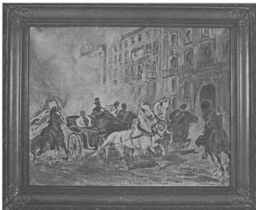
Józef Górski, Zamach na hr. Berga, olej, płótno