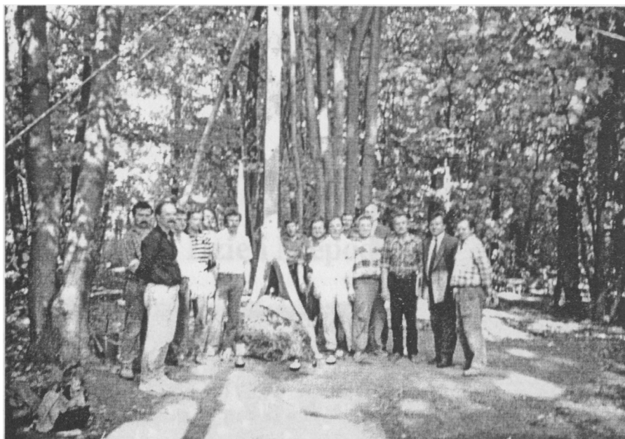
Krzyż przywieziony z Warszawy przez Komitet Katyński i ustawiony na „Czarnej Drodze” w Charkowie w sierpniu 1991 r. w czasie puczu w ZSRR