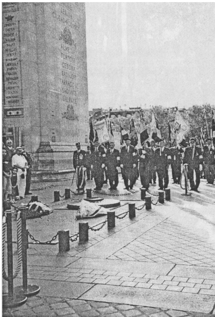
Delegacje Kręgu Pamięci Narodowej i SPK Francja składają kwiaty pod Łukiem Triumfalnym w Paryżu w rocznicę 15 sierpnia (2005 r.)