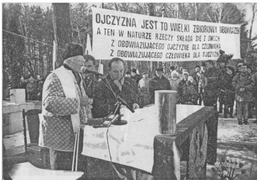
Olszynka – uroczystości w 1991 r.