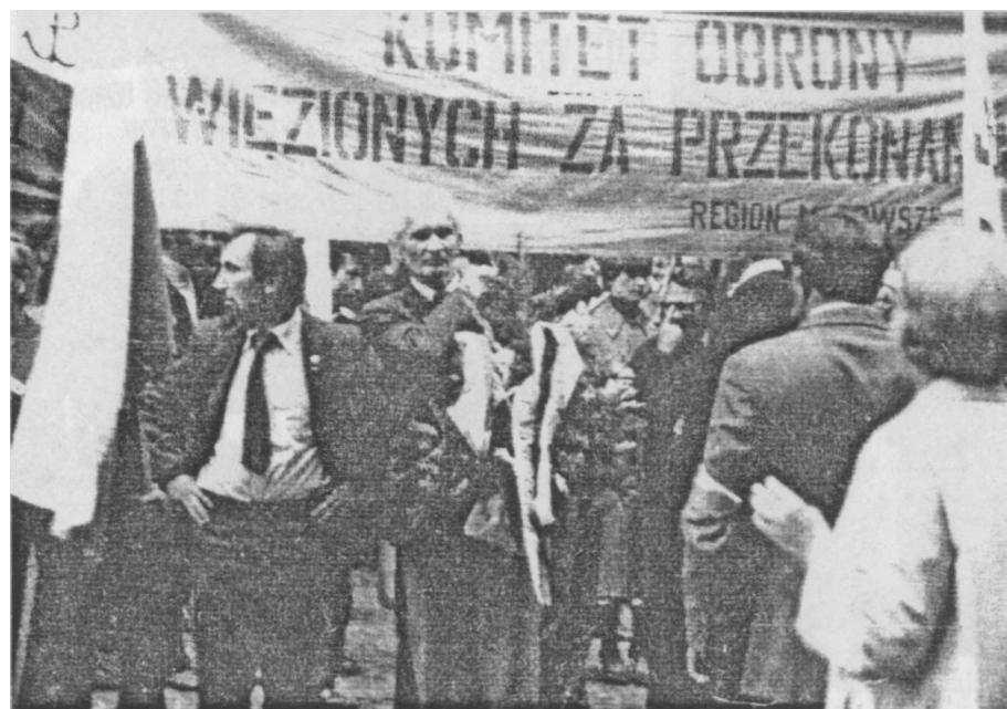
Komitet Katyński i Komitet Obrony Więzionych za Przekonania 17 IX 1981 r. na Powązkach przy Dolince Katyńskiej