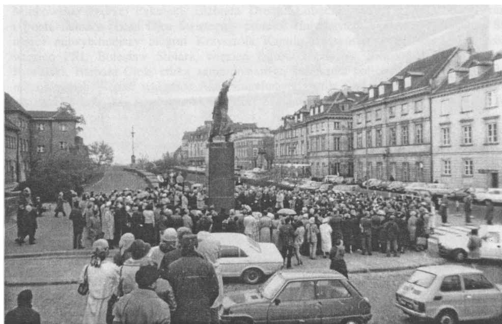
17 kwietnia 1984 r. – rocznica Insurekcji Warszawskiej przed pomnikiem Jana Kilińskiego