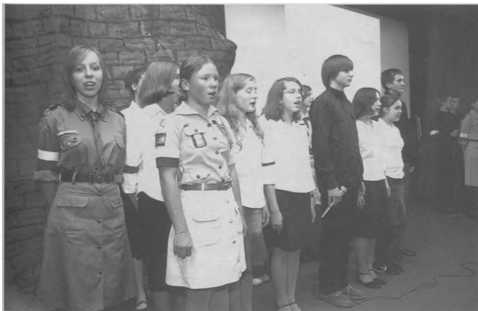
Koncert w wykonaniu młodzieży podczas uroczystości w ramach Roku Stefana Starzyńskiego (4 X 2004)