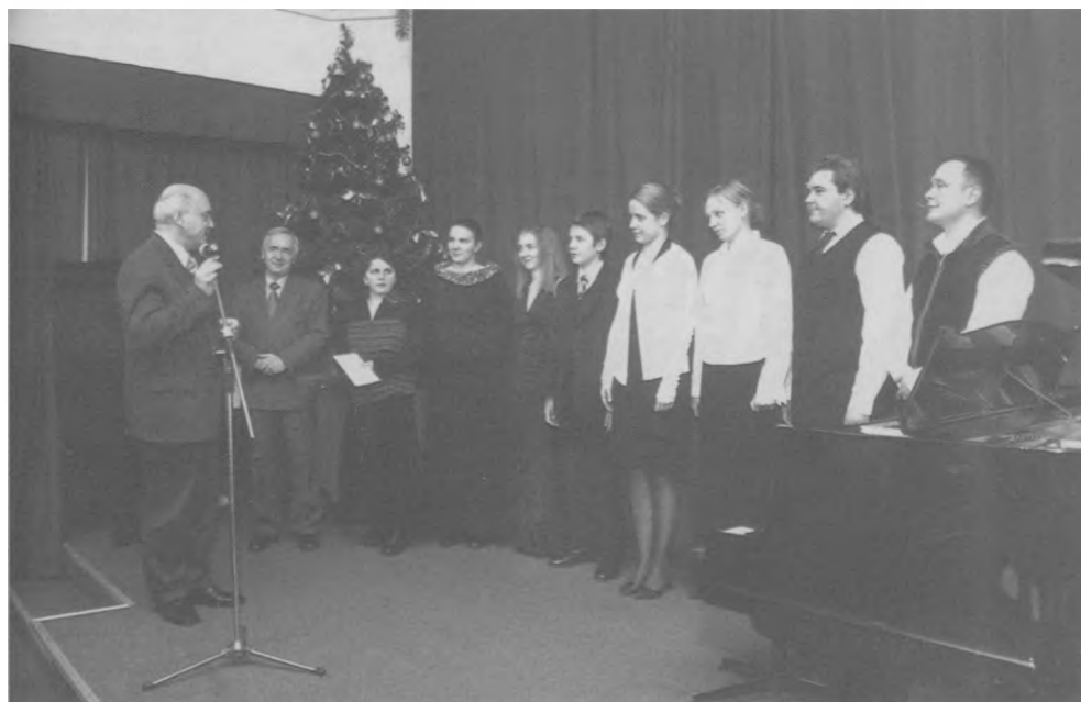
Noworoczny Koncert z Dedykacją zorganizowany przez Państwowy Zespół Szkół Muzycznych nr 1 im. F. Chopina w Warszawie (10 I 2005)