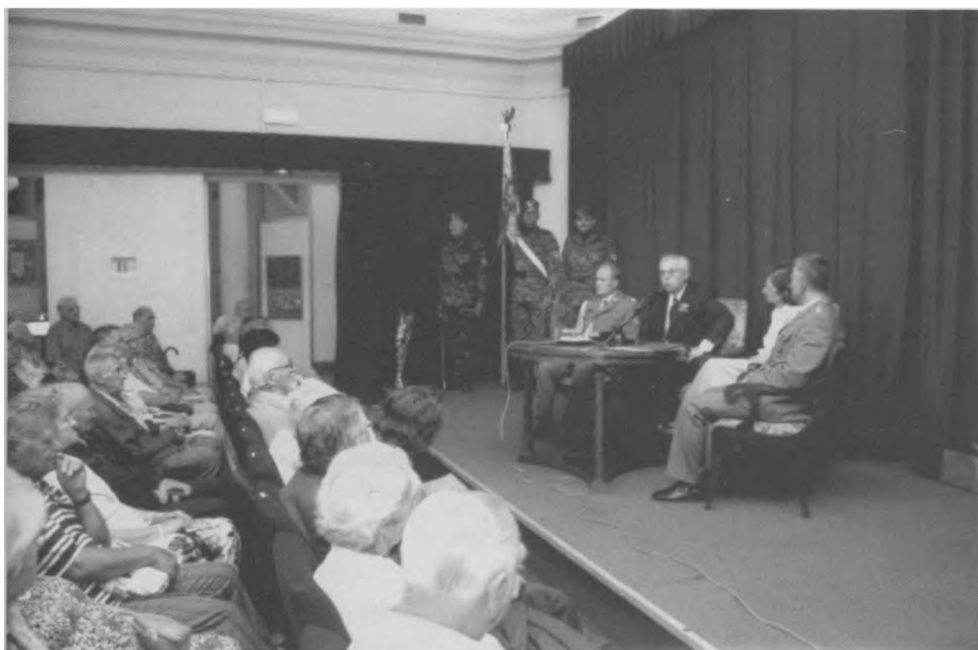
Spotkanie z cyklu „W marszu do niepodległości” w 65. rocznicę wybuchu II wojny światowej (30 VIII 2004)