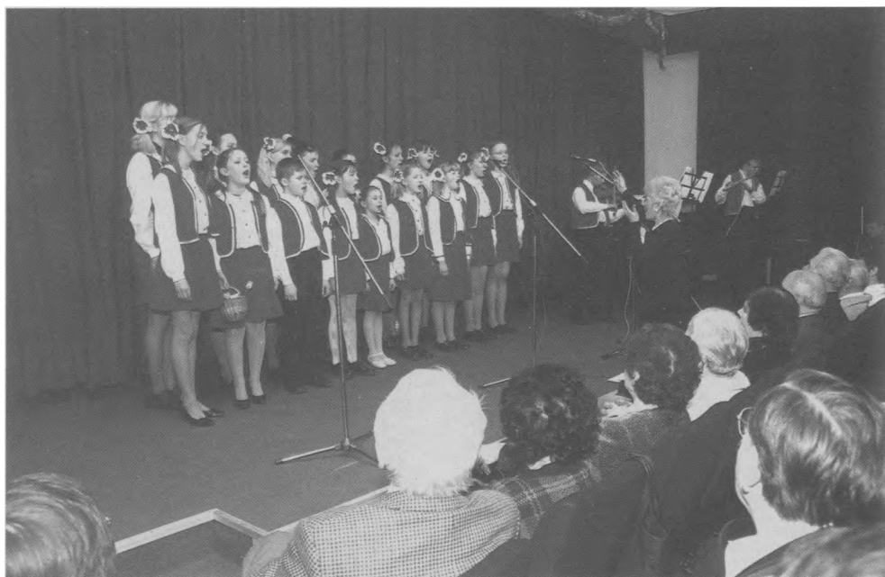
Koncert zespołu „Grodzieńskie Słowiki” z Grodna (7 I 2005)