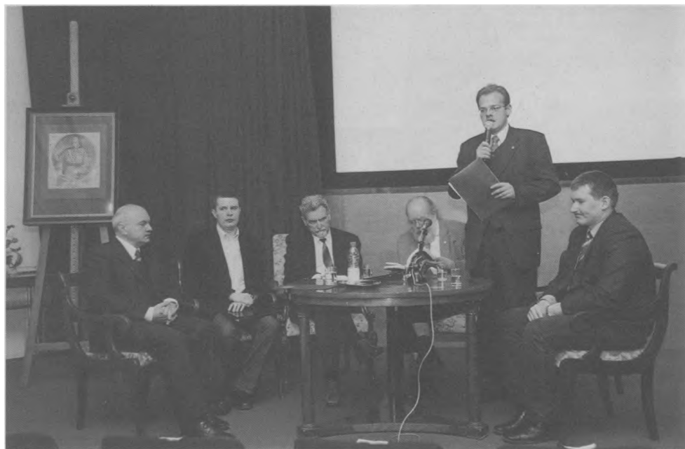
Dyskusja panelowa w 70. rocznicę śmierci Józefa Piłsudskiego pt. „Być dla Polski, dla Polaków” (19 V 2005)