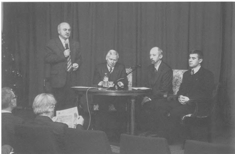
Dyskusja panelowa „Roman Dmowski a tożsamość narodowa Polaków” (4 I 2005)