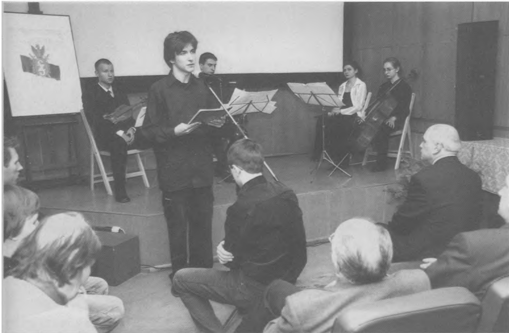
Koncert w wykonaniu młodzieży podczas otwarcia nowej wystawy stałej „Sybiracy 1940-1956” w Muzeum X Pawilonu C.W. (25 II 2005)