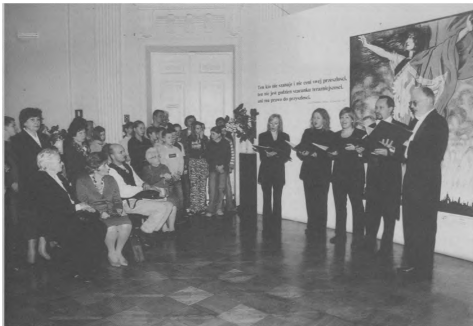
Dni Niepodległości 2004 – koncert zespołu „Favola in Musica” podczas otwarcia wystawy „Znaki państwa polskiego”