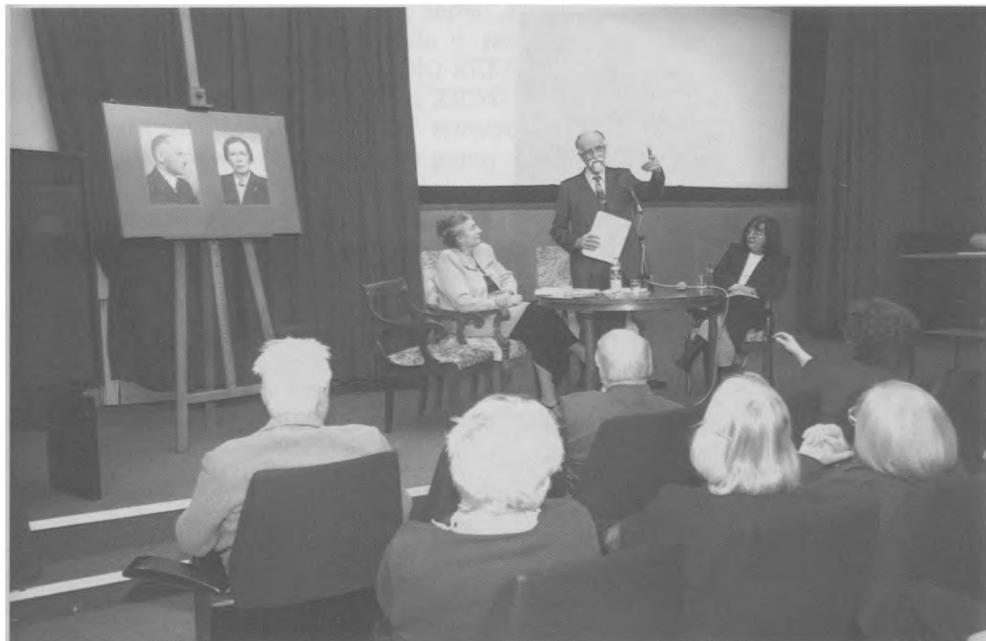
Spotkanie w ramach nowego cyklu „Słynni Krzemieńczanie” (4 III 2005)