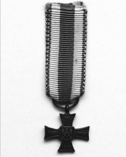
Miniatura Krzyża Walecznych. Prawdopodobnie okres międzywojenny.

w służbie państwowej. Nadano 60 tys. KW 50 tys. osób. Wielu żołnierzy otrzymało ten krzyż wielokrotnie. Prym wśród odznaczonych wiodły jednak jednostki wywodzące się z Legionów Polskich i te walczące na wschodzie. Np. żołnierze 3 pp Legionów mieli 4387 nadań KW 18 .