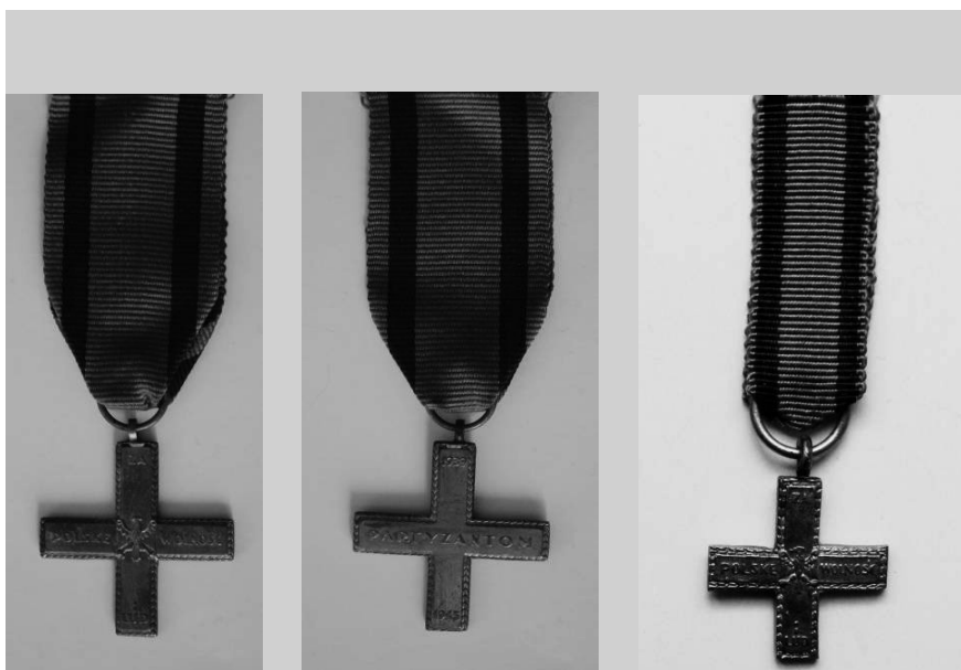
Krzyż Partyzancki. Od lewej: awers, rewers i miniatura. Nadany w 1948 r.

Najważniejszym odznaczeniem państwowym od dnia 2 lipca 1949 r. był Order Budowniczych Polski Ludowej. Nagradzać miał wybitne zasługi poniesione na rzecz budowy Polski Ludowej w różnych dziedzinach; od przemysłu po sztukę. Nadany mógł być tylko raz, a otrzymać go mogły instytucje, przedsiębiorstwa i jednostki terytorialne. Wykonany był ze złota (od 1952 zmniejszono wagę złota z 135 g do 87 g.). Otrzymali go między innymi: Karol Świerczewski, Zygmunt Berling, Bolesław Bierut, Władysław Gomułka, Jarosław Iwaszkiewicz, Henryk Jabłoński, Tadeusz Kotarbiński, Konstanty Rokossowski, Marian Spychalski, Stanisław Lorentz, Aleksander Zawadzki i Michał Rola-Żymierski. Do roku 1989 nadano