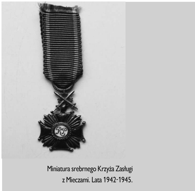
Miniatura srebrnego Krzyża Zasługi z Mieczami. Lata 1942-1945.