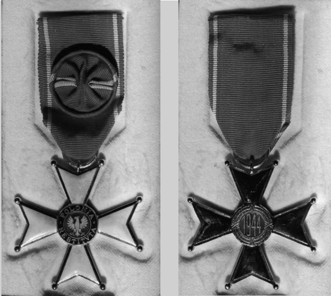
Krzyż Oficerski Orderu Polonia Restituta, wersja po 1944.

się nad nadaniem tego orderu Józefowi Stalinowi 28 . W odróżnieniu od władz polskich na uchodźstwie, Prezydium KRN do końca roku 1945 nadało 7 Orderów Virtuti Militari I klasy, a do 1983 r. nadano ich 17. Otrzymali je między innymi: Karol Świerczewski, Konstanty Rokossowski (jako marszałek ZSRR), Michał Rola-Żymierski (jako marszałek Polski), Leonid Breżniew (jako marszałek ZSRR), Iwan Koniew (jako marszałek ZSRR), Bernard Montgomery (jako marszałek Wielkiej Brytanii), Ludwik Svoboda (jako generał Czechosłowackiej Armii Ludowej), Josip Tito (jako marszałek Jugosławii) i Georgij Żukow (jako marszałek ZSRR).