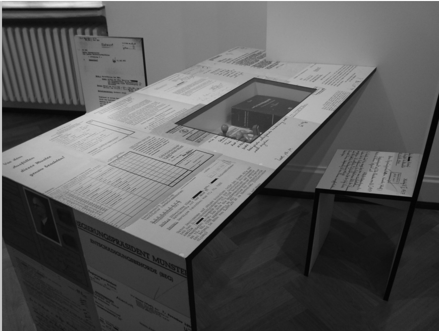
Villa ten Hoppel. Fragment wystawy pt. Odszkodowania jako powinność z symbolicznym biurkiem, przy którym odbywały się rozmowy z osobami starającymi się o odszkodowania, MÜNSTER

Villa ten Hoppel jest też miejscem prężnej działalności edukacyjnej. Obok różnorodnej tematyki zajęć, odbywają się tu seminaria. Istnieje również możliwość korzystania z biblioteki i archiwum. Pracownicy i wolontariusze biorą udział w tworzeniu projektów edukacyjnych, organizują też wycieczki do innych miejsc pamięci. Są autorami tzw. „walizki historycznej” – zbioru materiałów edukacyjnych, które szkoły mogą wypożyczyć do celów dydaktycznych.