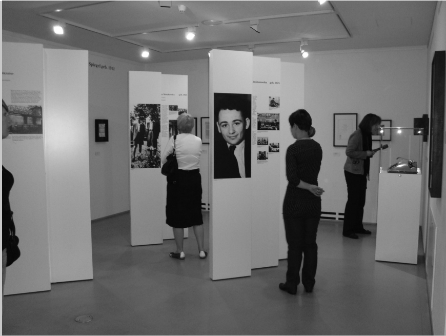
Fragment wystawy pt. Żydowskie drogi w Westfalii , DORSTEN

zuje wykłady, wieczory filmowe, wycieczki oraz inne imprezy kulturalne: odczyty, spotkania muzyczne i teatralne. Ponadto muzeum oferuje semina-ria dla grup: zwiedzanie z przewodnikiem, projekcje filmów i samodzielne prace badawcze.