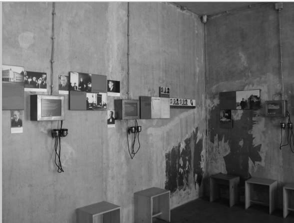
Fragment wystawy stałej pt. Kolonia w okresie rządów narodowosocjalistycznych wzbogaconej o multimedia, KÖLN

Wystawa w budynku EL-DE zrobiła na mnie bardzo duże wrażenie, szczególnie ciekawy projekt plastyczny: ściany zostały w odpowiedni sposób „postarzone”, a wszelkie multimedia, w tym różnego typu słuchawki wyglądem nawiązują do epoki. Na podłodze przez całą powierzchnię ekspozycji przebiega „linia czasu”. Wystawa prezentowana jest na I i II piętrze budynku i została podzielona na poszczególne tematy, m.in.: przejście władzy przez nazistów, życie codzienne w III Rzeszy, szkolnictwo, losy ludności żydowskiej, prześladowania na tle rasowym, praca przymusowa, zakończenie działań wojennych w Kolonii i okręgu. Sporo miejsca poświęcono też poszczególnym sprawcom.