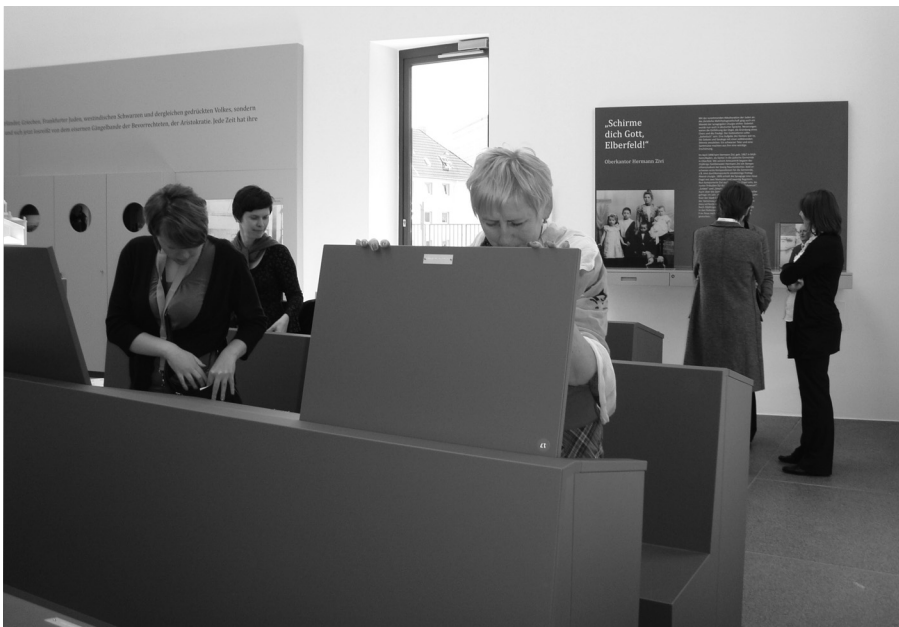
Fragment wystawy w Miejscu Spotkań Stara Synagoga, WUPPERTAL

Wystawa, którą zwiedzaliśmy została otwarta w kwietniu 2011 r. i dokumentuje losy lokalnej społeczności żydowskiej aż po czasy współczesne. Ekspozycja jest nowoczesna, ciekawie zaaranżowana, tak aby zwiedzający mogli w sposób indywidualny pogłębiać wiedzę na przedstawione tematy poprzez indywidualne szukanie, sprawdzanie, zagłębienie we wszystkie dostępne na ekspozycji zakamarki. Jedną z ciekawszych form wystawienniczych na tej ekspozycji są nowe ławki-gabloty, które znajdują się dokładnie w tym samym miejscu, gdzie znajdowały się oryginalne w Starej Synagodze. Zwiedzający chcąc obejrzeć eksponaty, muszą podnieść pulpity ławek-gablót.