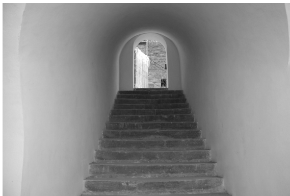
Klatka schodowa przy Bramie Bielańskiej