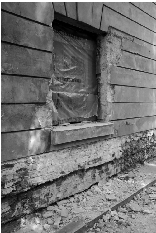
Jedno z okien X Pawilonu od strony dziedzińca