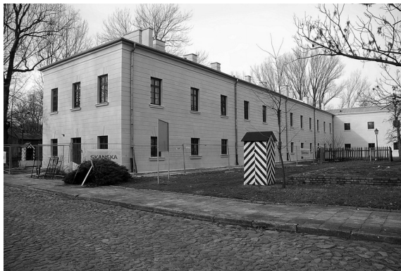
Zachodnie skrzydło X Pawilonu z fragmentem przylegającego doń głównego korpusu