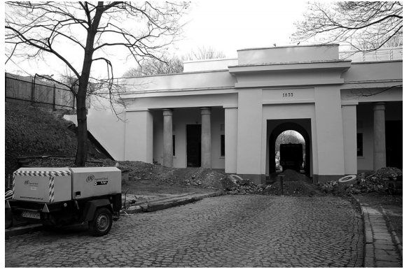
Brama Bielańska; widok od strony wewnętrznej