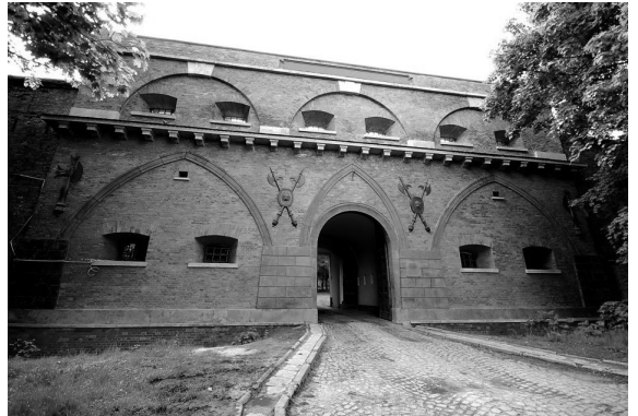
Brama Bielańska, widok od strony zewnętrznej