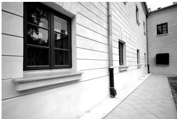
Fragment elewacji głównego korpusu X Pawilonu, widok od strony dziedzińca