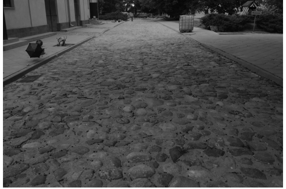
Przekładanie nawierzchni brukowej na terenie muzealnym