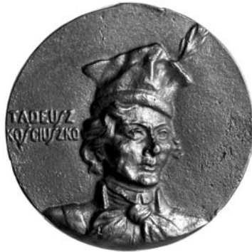
NN, Polska, MNE 8568

Aby obraz warszawskiej kolekcji był pełny, trzeba tu jeszcze zaprezentować dwa medale, które nie zostały w żaden sposób osygnowane. Trudno również określić czas ich powstania, autorstwo, a także miejsce wytworzenia. Uzupełnienie tych danych byłoby możliwe w wyniku żmudnych poszukiwań w literaturze przedmiotu czy też w wyniku analiz porównawczych w oparciu o inne kolekcje numizmatyczne.