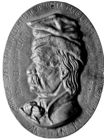
NN, Polska – Warszawa (?), koniec XIX w., MNE 8767

Pierwsza z nich, owalna, o pionowej orientacji plakieta, z postacią z profilem zwróconym w lewo. Dookolnie został wykonany napis BO-DAJ SIĘ SZEWC TAKI ŚWIECIE – NIECH SIĘ ŚWIĘCĄ TAKIE LATA – WIWAT! POLSKA CNOTA \ OBYWATEL OD WARSZTATA – JAN KILIŃSKI PATRYOTA. Niestety, również w przypadku tej pamiątki, nie znamy ani autora, ani inicjatora jej stworzenia, a także miejsca jej odlania. Jej wykonanie nie świadczy najlepiej o twórcach. O ile sama podobizna Jana Kilińskiego jest w miarę dobrze wykonana, o tyle napis został zrobiony bardzo niestarannie, przez co miejscami jest trudny do odczytania. Może to sugerować również, że jest to kopia.