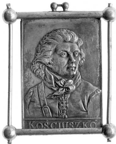
Firma Braci Lauer, Norymberga ok. 1890 r., MNE 12366

Następna plakietka posiada odmienną formę. Jednakże z uwagi na materiał, z jakiego została wykonana – srebrzony stop metalu – należy ją tutaj zaprezentować. Jest ona jednostronna i znajduje się na niej popiersie z głową zwróconą 3/4 w prawo. U dołu, na wydzielonym pasie widnieje napis KOŚCIUSZKO. Również w tym przypadku pierwowzorem dla ukazania wizerunku stał się portret Oleszczyńskiego. Wyróżnikiem w stosunku do innych jest umieszczenie jej w ozdobnej metalowej ramce, której narożniki zostały zaopatrzone w dekoracyjne kulki. W części górnej znajduje się też prostokątne zawieszanie. Wymiary plakietki to wysokość 6 cm i szerokość 4,7 cm. Jej producentem była firma braci Lauer z Norymbergi około roku 1890. Jak można przypuszczać, jej produkcja nawiązywała do 100. rocznicy Insurekcji Kościuszkowskiej w 1894 roku 9 .