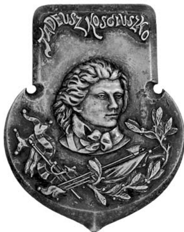
NN, Polska, koniec XIX w., MNE 12528

Kolejna plakieta stanowi przykład jednej z typowych prac w zakresie produkcji pamiątek patriotycznych na przełomie XIX i XX wieku. Ma ona kształt tarczy o wysokości 6,8 cm i szerokości 4,9 cm. Na głównej stronie znajduje się głowa Kościuszki zwrócona 3/4 w prawo. Powyżej, przy zastosowaniu ozdobnego liternictwa, został wykonany napis TADEUSZ KOŚCIUSZKO. Poniżej wizerunku znajdują się elementy zdobnicze – po lewej szarfa, pośrodku atrybuty wojskowe, a po prawej gałązka oliwna. Niestety, w tym przypadku nie znamy ani autora, ani miejsca jej wytworzenia 11 .