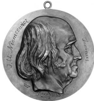
Piotr Jan David d'Angers, Francja – Polska, poł. XIX w., MNE 8565

Ten sam autor, w tym samym czasie stworzył kolejną plakię, którą w tej prezentacji winniśmy uwzględnić. Została ona poświęcona Julianowi Ursynowi Niemcewiczowi 8 . Na plakiecie znajduje się zwrócony w prawo profil głowy mężczyzny o poważnym wyrazie twarzy. W 3/4 obwodu znajduje się napis J. U. NIEMCEWICZ. Podobnie jak poprzednia, tak i ta została odlana na podstawie francuskiego oryginału w Warszawie. Tym razem jej producentem była Wytwórnia Braci Łopieńskich. Również i w tym przypadku na plakiecie została zachowana sygnatura autora pierwowzoru P. J. DAVID wraz, jak można sądzić, z datą powstania pierwowzoru – 1833. Dla pełni informacji należy jeszcze wspomnieć, iż obie plakiety mają 16 cm średnicy i zostały w części górnej zaopatrzone w zawiesia.