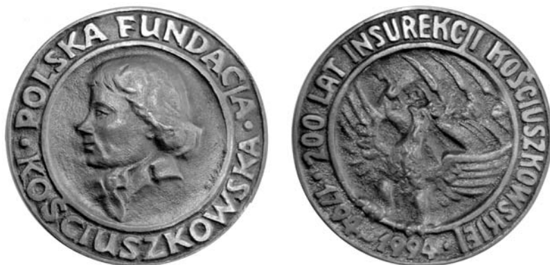
NN, Polska – Warszawa(?) 1994, MNE 14020

Z tego jubileuszowego 1994 roku w kolekcji Muzeum Niepodległości pochodzi jeden medal, którego wydawcą jest Polska Fundacja Kościuszkowska. Niestety, nie znamy ani miejsca jego powstania, ani wykonania. Co prawda na awersie po prawej stronie znajduje się sygnatura, jednak jest ona na tyle nieczytelna, iż uniemożliwia rozszyfrowanie.