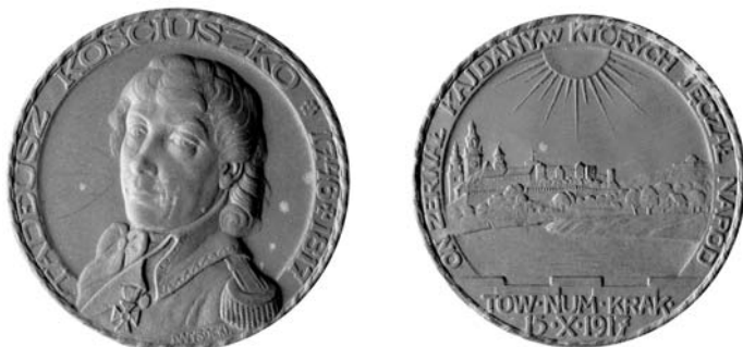
Jan Wysocki, Kraków–Wiedeń, 1917, MNE 4902

argument o potrzebie wypełnienia otoku w celach kompozycyjnych. Ten zabieg zyskał ostatecznie aprobatę emitenta i nie przeszkodził w dalszej popularyzacji medalu.