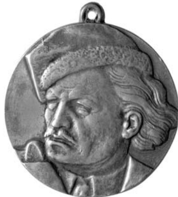
NN, Polska, MNE 8765

Pierwszy z nich dotyczy samego Kościuszki. Jest to jednostronnie odlana w mosiądzu plakieta o średnicy 8 cm. Na gładkiej powierzchni znajduje się popiersie Naczelnika zwrócone 3/4 w prawo, a po lewej stronie napis: TADEUSZ KOŚCIUSZKO.