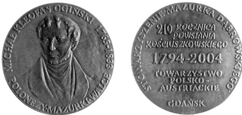
NN, Polska – Gdańsk, 2004 MNE 16478

Kolejny medal został wyemitowany już w XXI wieku. Tym razem dotyczy on kompozytora Michała Kleofasa Ogińskiego 39 . Jest to kolejny przykład medalu powstałego z inicjatywy społecznej. Tym razem są to dwie organizacje – Towarzystwo Polsko-Austriackie w Gdańsku i Stowarzyszenia Miłośników Tradycji Mazurka Dąbrowskiego w Gdańsku.