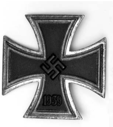
Krzyż Żelazny kl. I

swastyka, a na dolnym ramieniu data „1939”. Zmianie uległy również barwy wstążki, dotychczasowa czarna z białymi paskami została zastąpiona przez czerwoną z biało-czarnymi paskami przy krawędzi, ponadto wprowadzono również dodatkowo, oprócz dotychczasowych trzech klas Krzyża Żelaznego, pięć klas Krzyża Rycerskiego Krzyża Żelaznego (Krzyż Rycerski Krzyża Żelaznego oraz ozdobiony Liśćmi Dębu, Mieczami, Brylantami, Złotymi Liśćmi Dębu).