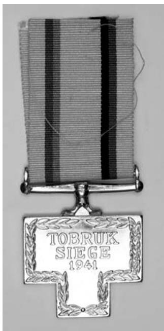
Medal Siege of Tobruk

Jednocześnie Distinguished Service Order został pozostawiony tylko jako nagroda za wybitne dowodzenie, natomiast w miejsce jego oraz Distinguished Conduct Medal, a także ich odpowiedników w marynarce i siłach powietrznych za męstwo i odwagę w obliczu wroga został wprowadzony Conspicuous Gallantry Cross (Krzyż za Wybitną Odwagę).