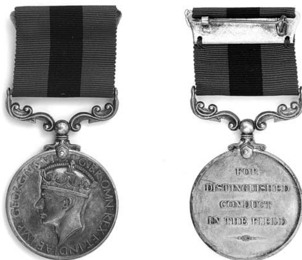
Distinguished Conduct Medal – awers i rewers