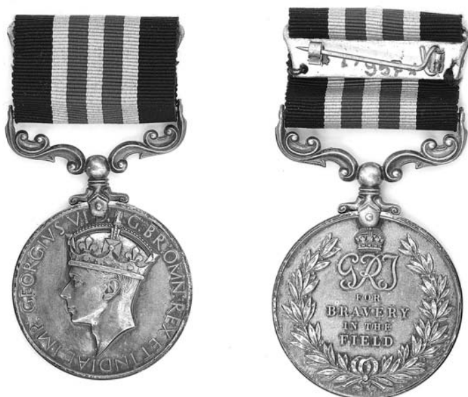
Military Medal – awers i rewers