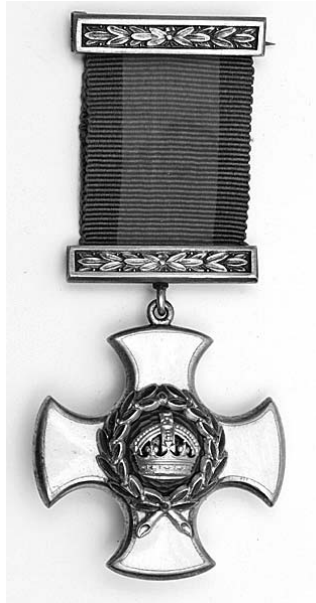
Distinguished Service Order, awers