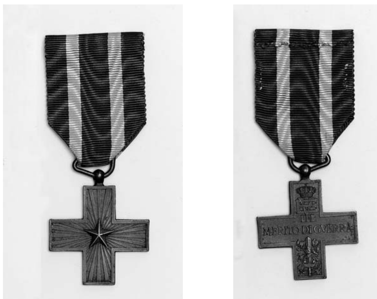
Croce di Guerra al Valore Militare – awers i rewers

VALOR MILITARE” 54 . Do 1943 roku wstążka medalu była niebieska z białymi paskami po bokach 55 . Oznacza to, że za walki o Tobruk żołnierze włoscy otrzymywali krzyż na wstążce niebieskiej z białymi paskami, zaś napis na krzyżu mógł być różny w zależności od tego, kiedy otrzymali odznaczenie.