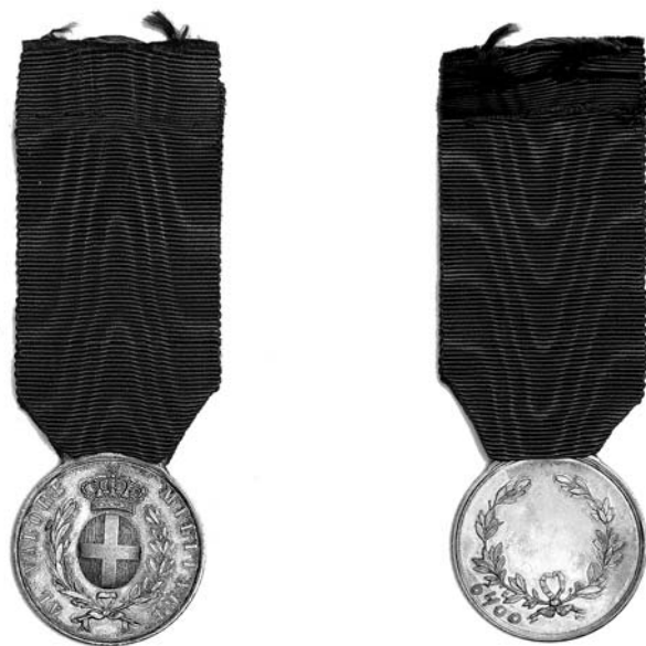
Medaglia al Valore Militare – awers i rewers

podczas II wojny światowej. Na wstążce mogą być noszone okucia (jest ich 15) z nazwami bitew lub działań bojowych, w których brali udział odznaczeni. Jedno z okuc „TOBRUK” poświęcone jest bitwie o Tobruk.