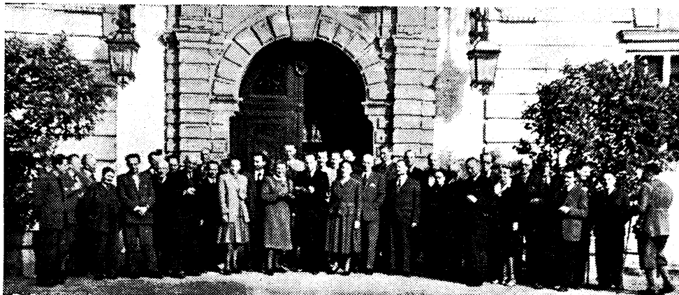
Ryc. 125. Uczestnicy Zjazdu Konserwatorów w Łańcucie przed bramą zamku.