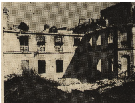
Ryc. 146. Pałac Blanka w Warszawie. Stan w r. 1945.