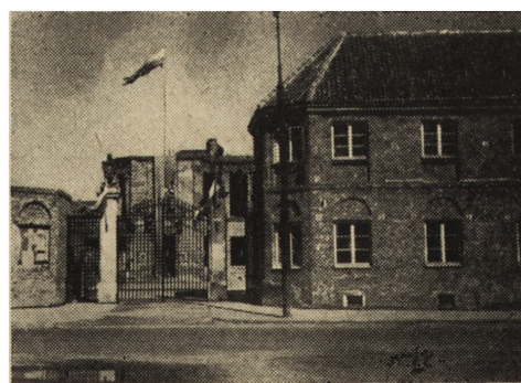
Ryc. 147. Pałac Blanka w Warszawie po ukończonej konserwacji w r. 1949.