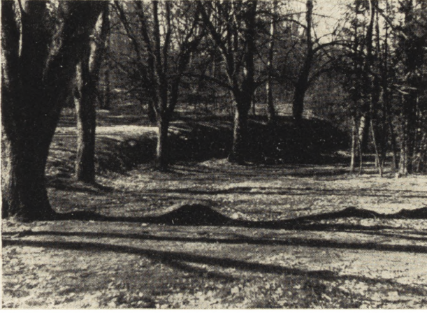
Ryc. 107. Rogalin. Widok na kopiec „Parnas“. (Fot. G. Ciołek).