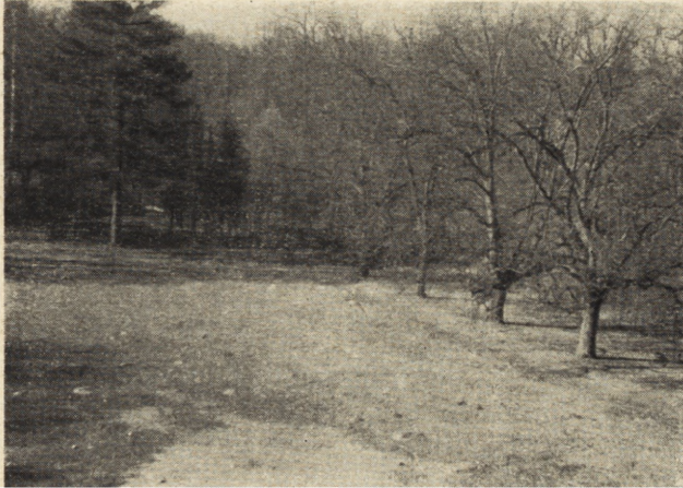
Ryc. 105. Rogalin. Wielki parter przed rekonstrukcją.