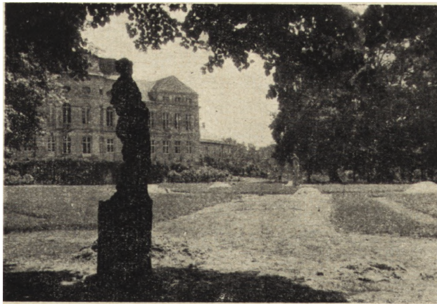
Ryc. 106. Rogalin. Wielki parter podczas prac rekonstrukcyjnych..