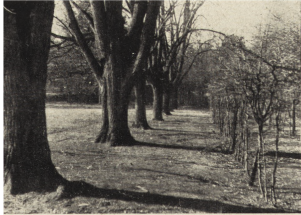
Ryc. 108. Rogalin. Szpaler lipowy przy parterze.