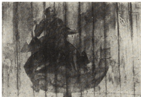
Ryc. 190. Wełna — kość. drewniany. Fragment malowidła na stropie prezbiterium przed konserwacją.