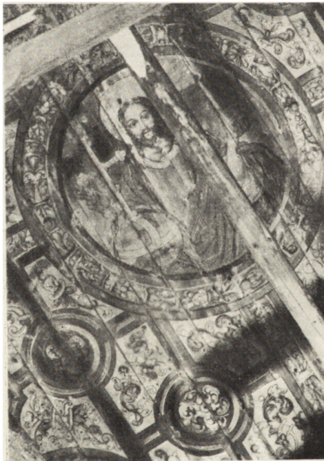
Ryc. 188. Boguszyce — kośc. drewniany. Fragment polichromii stropu w prezbiterium podczas konserwacji.