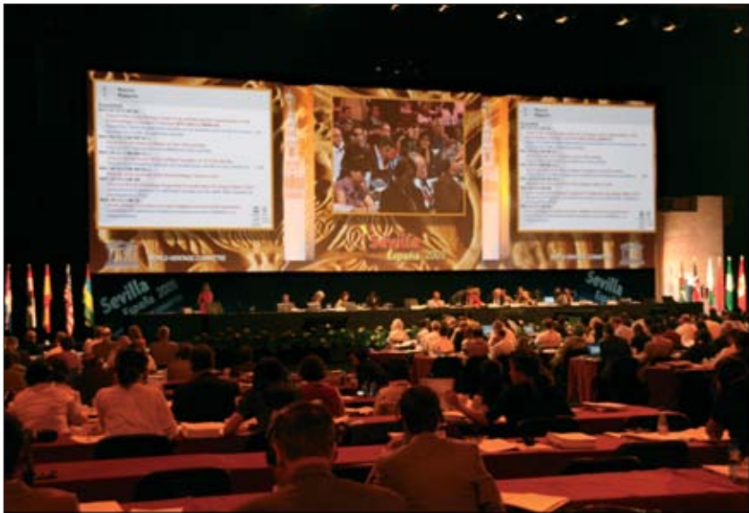
1. Obrady Komitetu Światowego Dziedzictwa UNESCO.