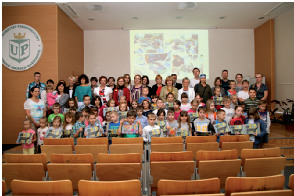
Młodzi artyści, uczestnicy projektu „Na ścieżkach wyobraźni”

Drugi dzień konferencji rozpoczęliśmy od sesji plenarnej, a po przerwie obrady odbywały się w dwóch sekcjach.