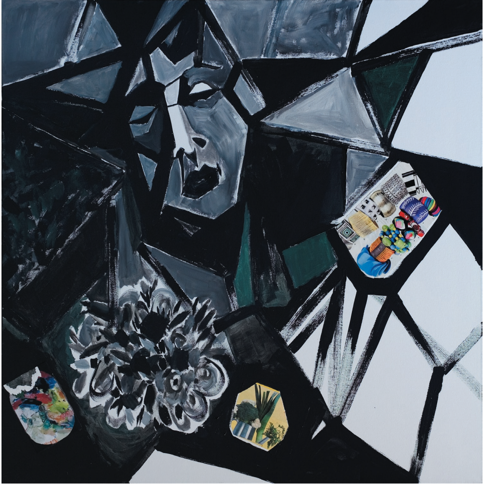
Psalm Dawidowy 71, akryl, płótno, 2011