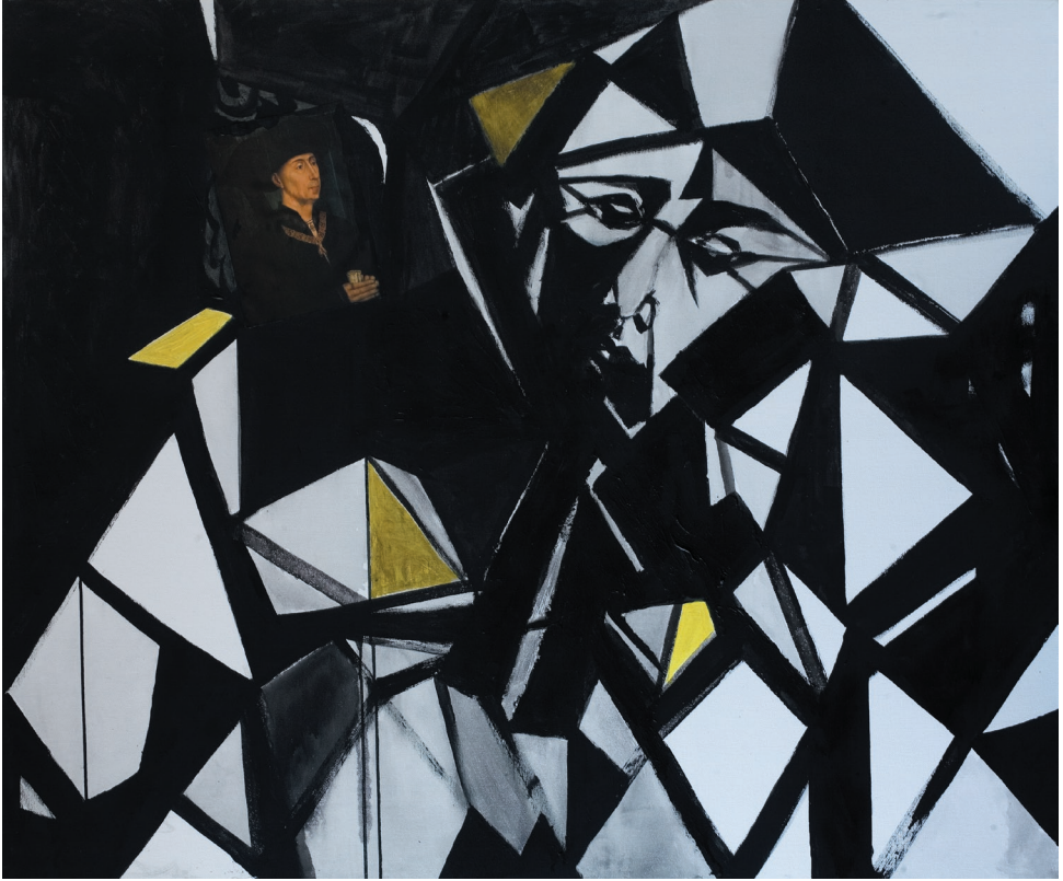
Rycerski Zakon Złotego Runa 1450, akryl, płótno, 2011