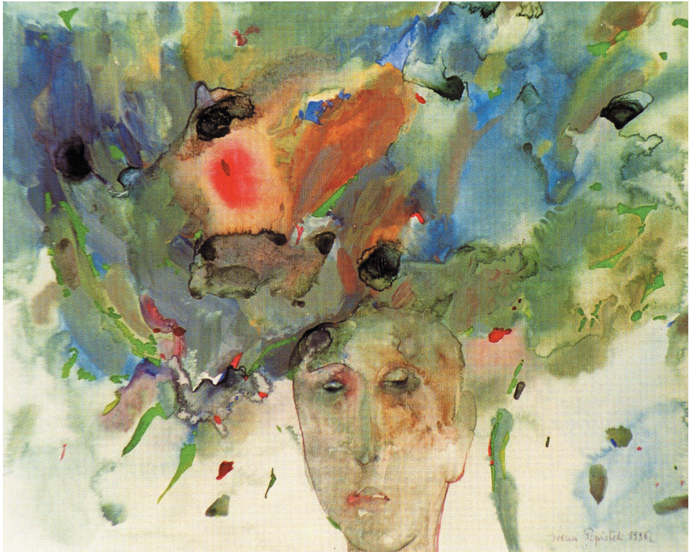
Portret ulubiony przez S. R., akwarela, papier, 1996