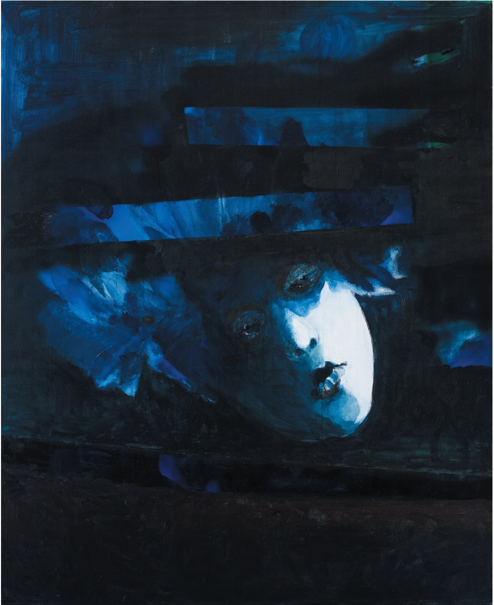
Psalm Dawidowy 50, akryl, płótno, 2011