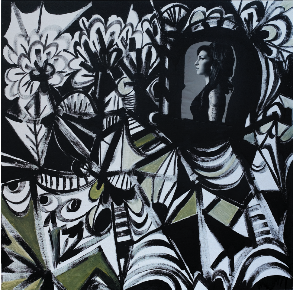
Epitafium dla Amy , akryl, płótno, 2011