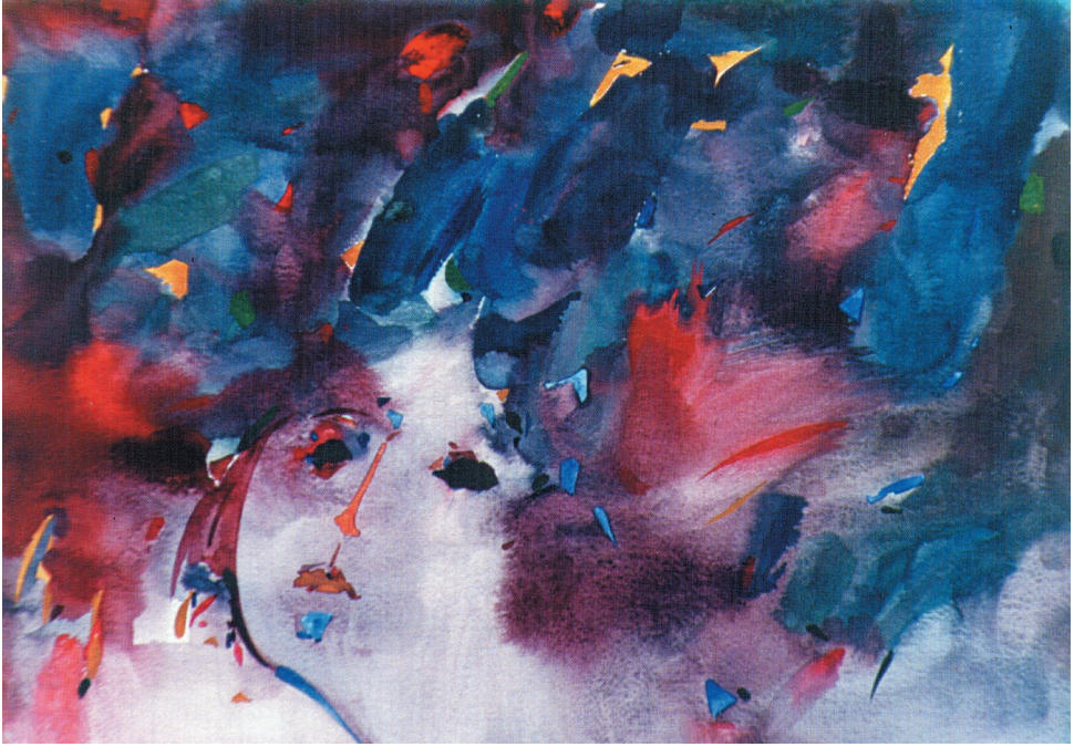
Pejzaż w tle, akwarela, papier, 1997