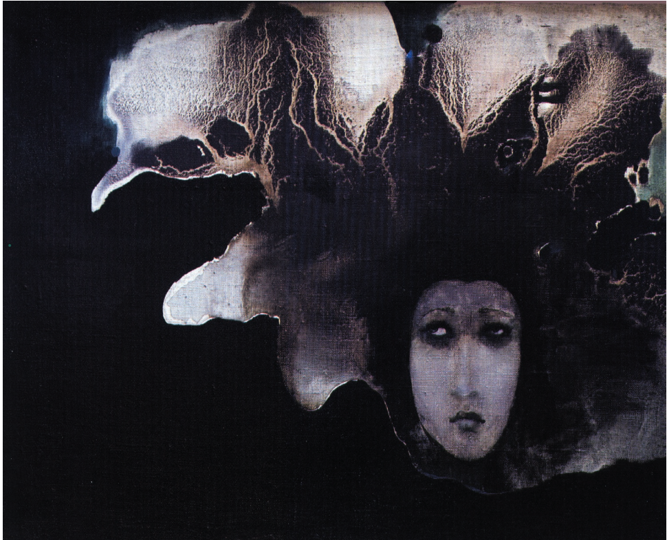
Portret XI , akryl, płótno, 2008