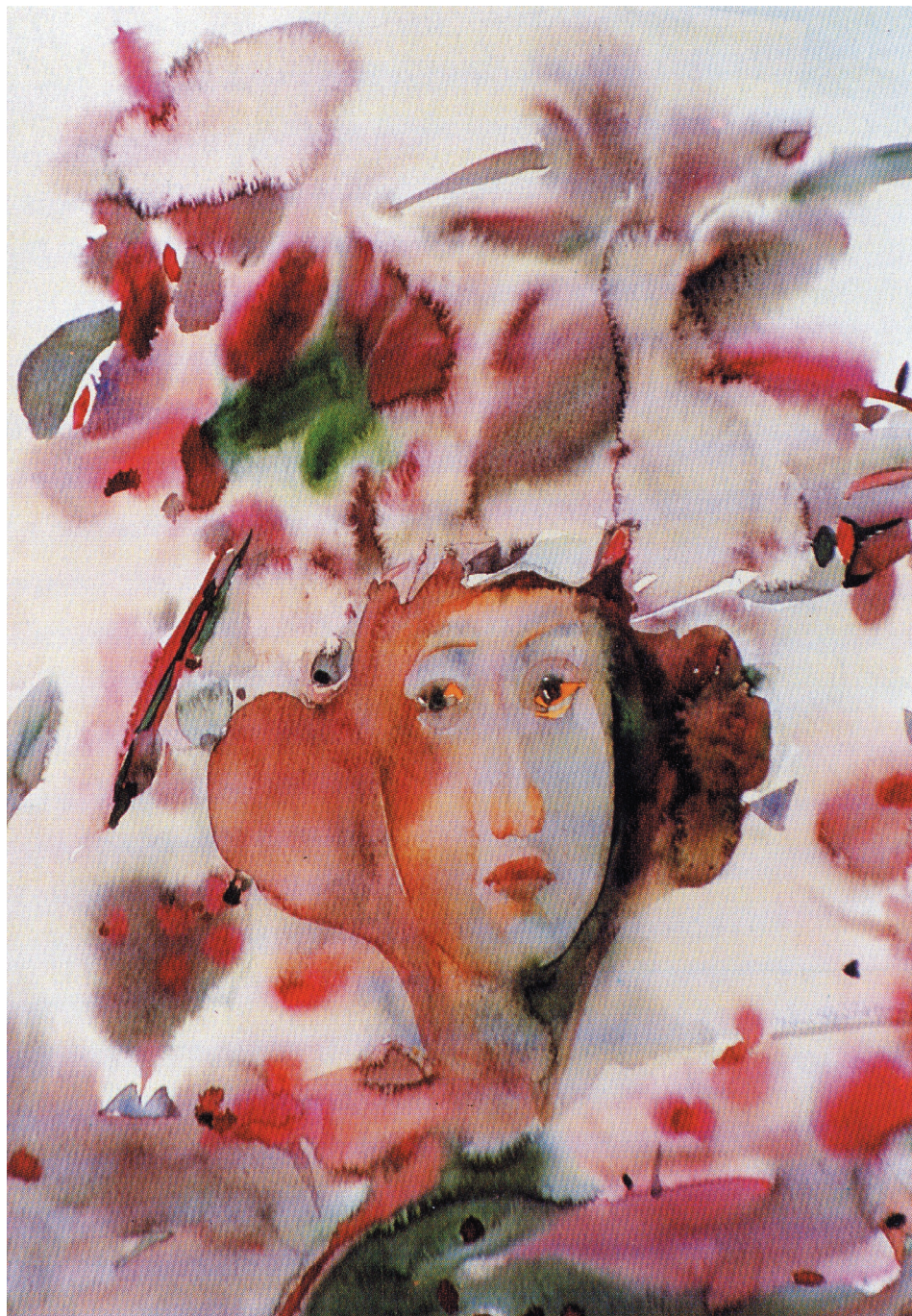
Klauzura , akwarela, papier, 1998