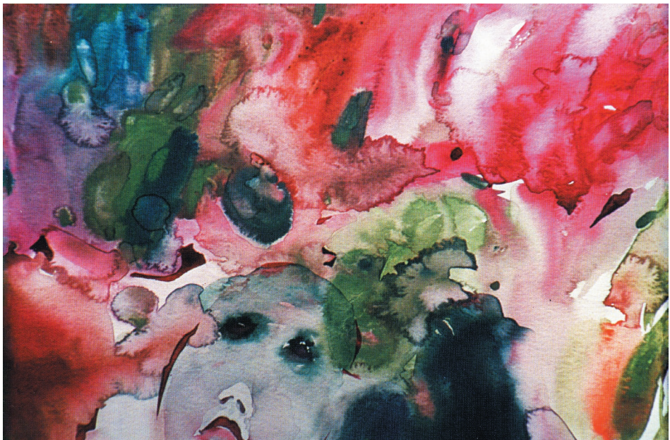
Odosobnienie, akwarela, papier, 1998