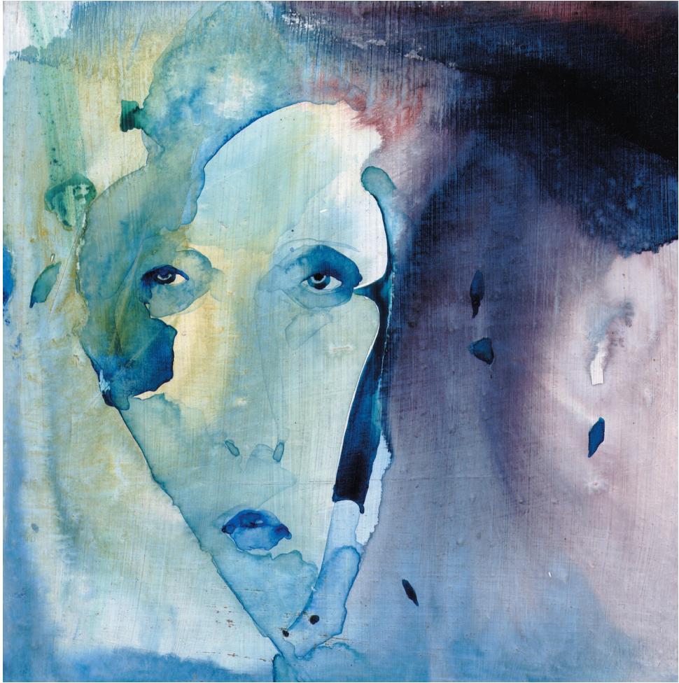
Portret X , akryl, płyta piślniowa, 2005