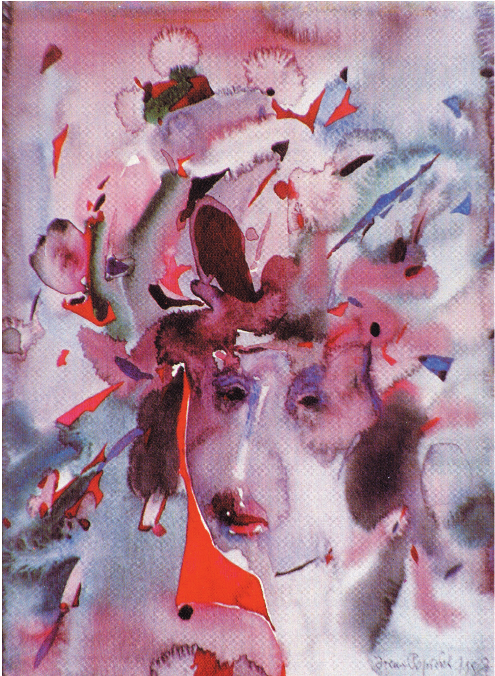
Wtajemniczona , akwarela, papier, 1997