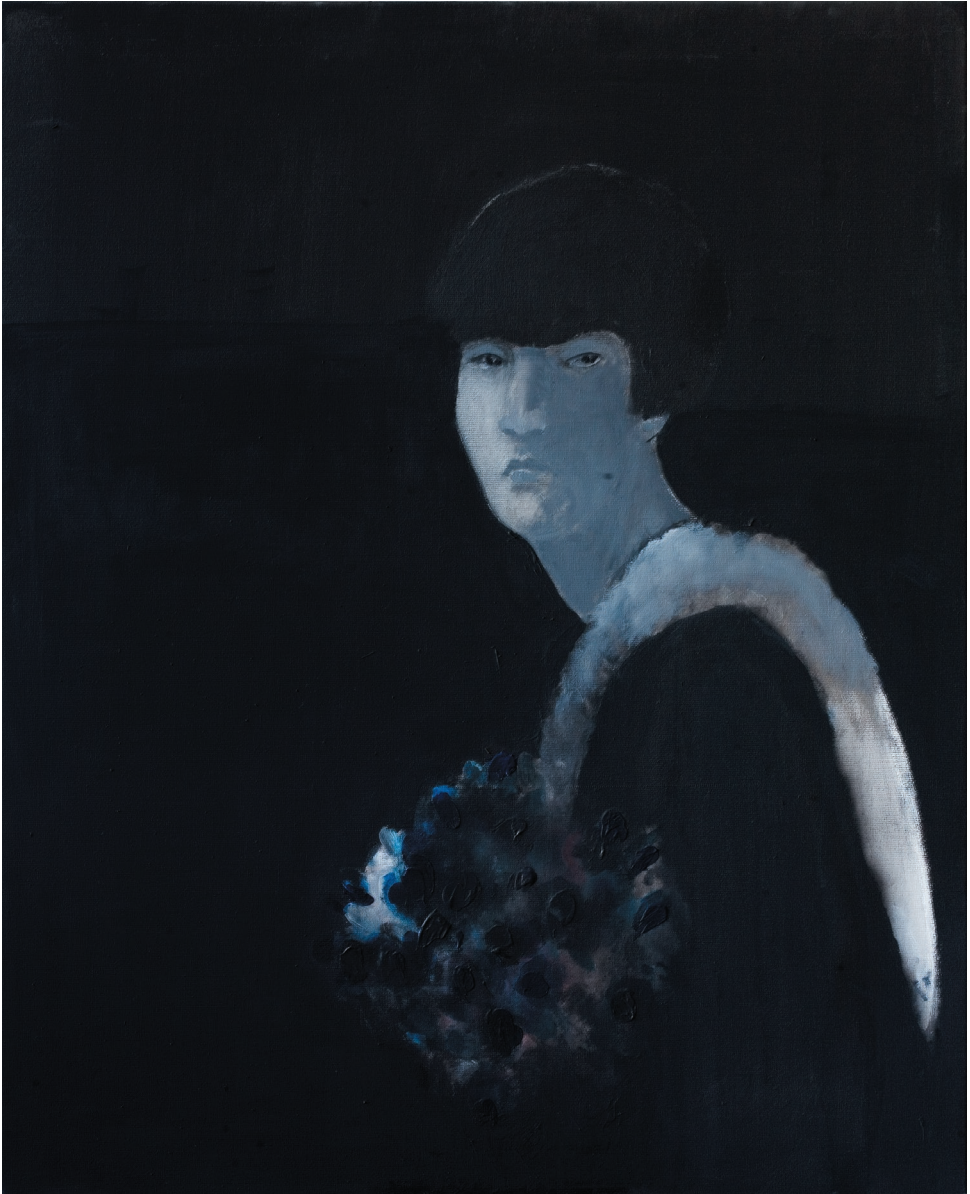
W czerni , akryl, płótno, 2010