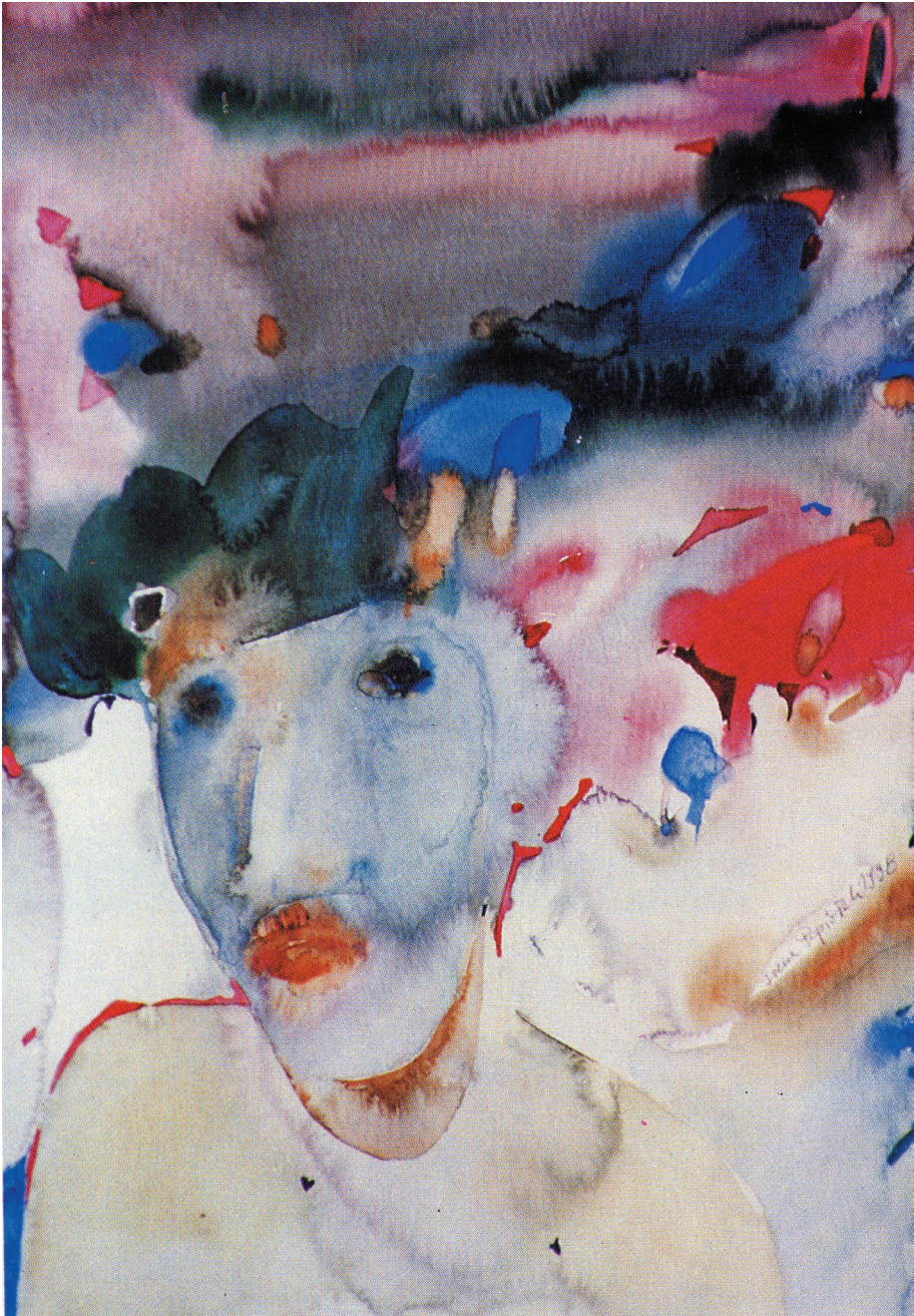
Przejsście , akwarela, papier, 1998