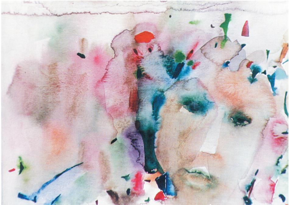
Przejsie przez..., akwarela, papier, 1997