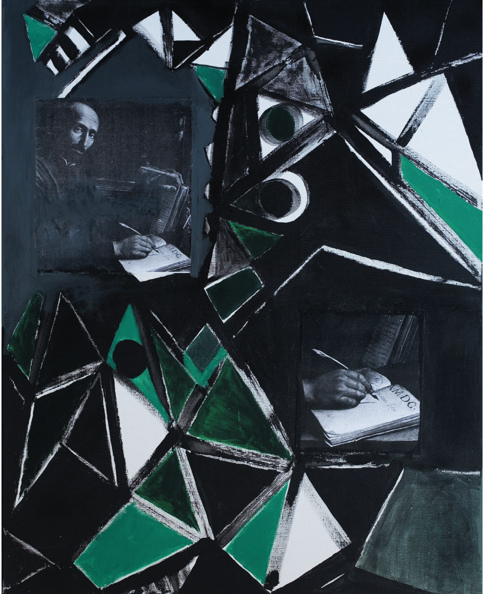
Manresa 1522 , akryl, płótno, 2011