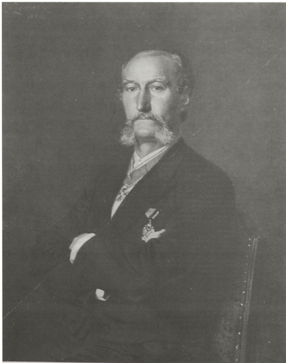
Fig. 1. Antonín Randa (1834–1914)