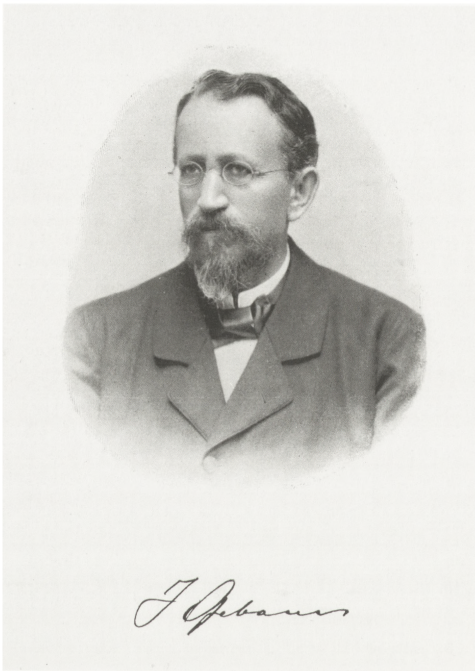
Fig. 2. Jan Gebauer (1838–1907)