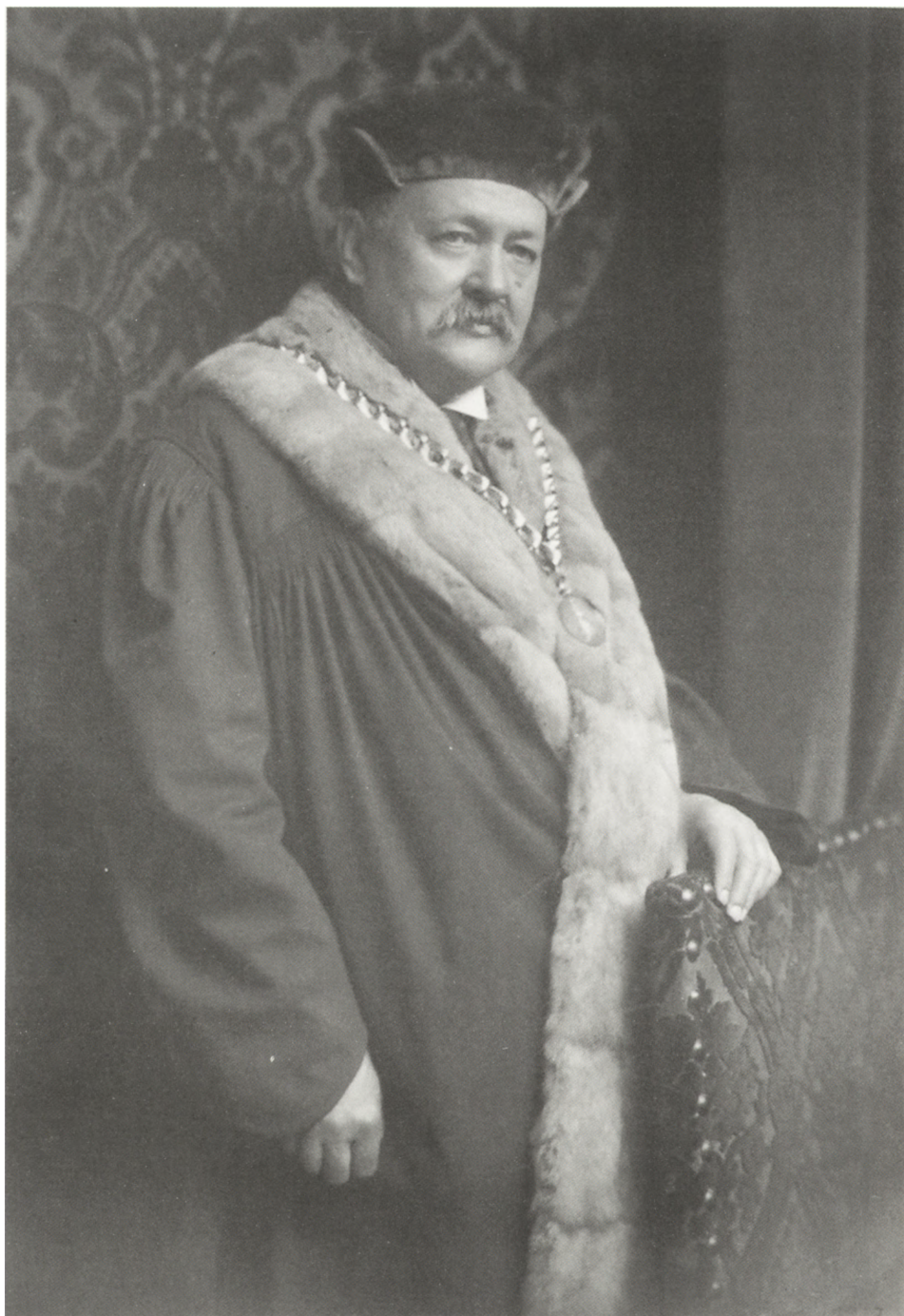
Fig. 6. Josef Pekař (1870–1937)