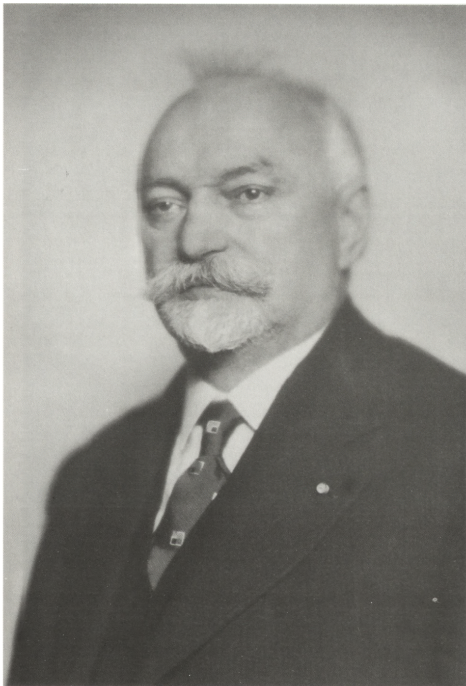
Fig. 7. Bohumil Němec (1873–1966)