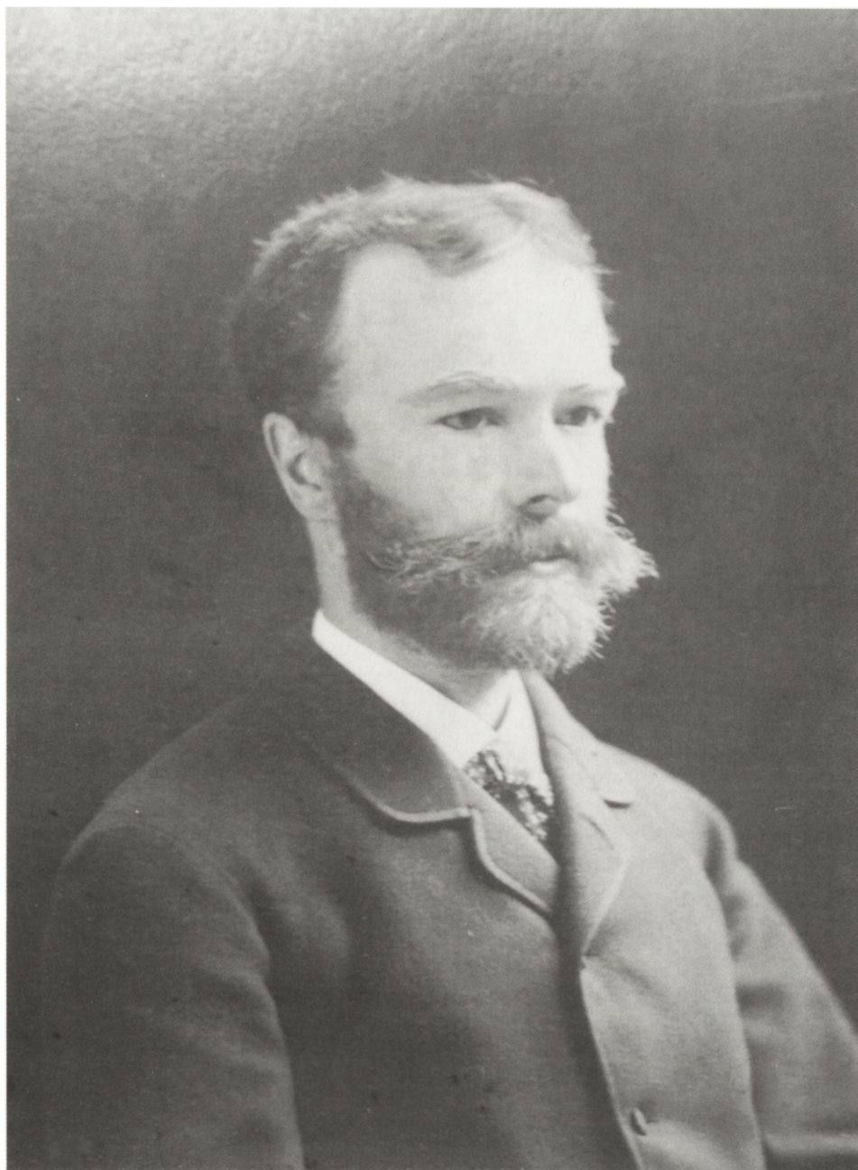
Fig. 3. Jaroslav Goll (1846-1929)