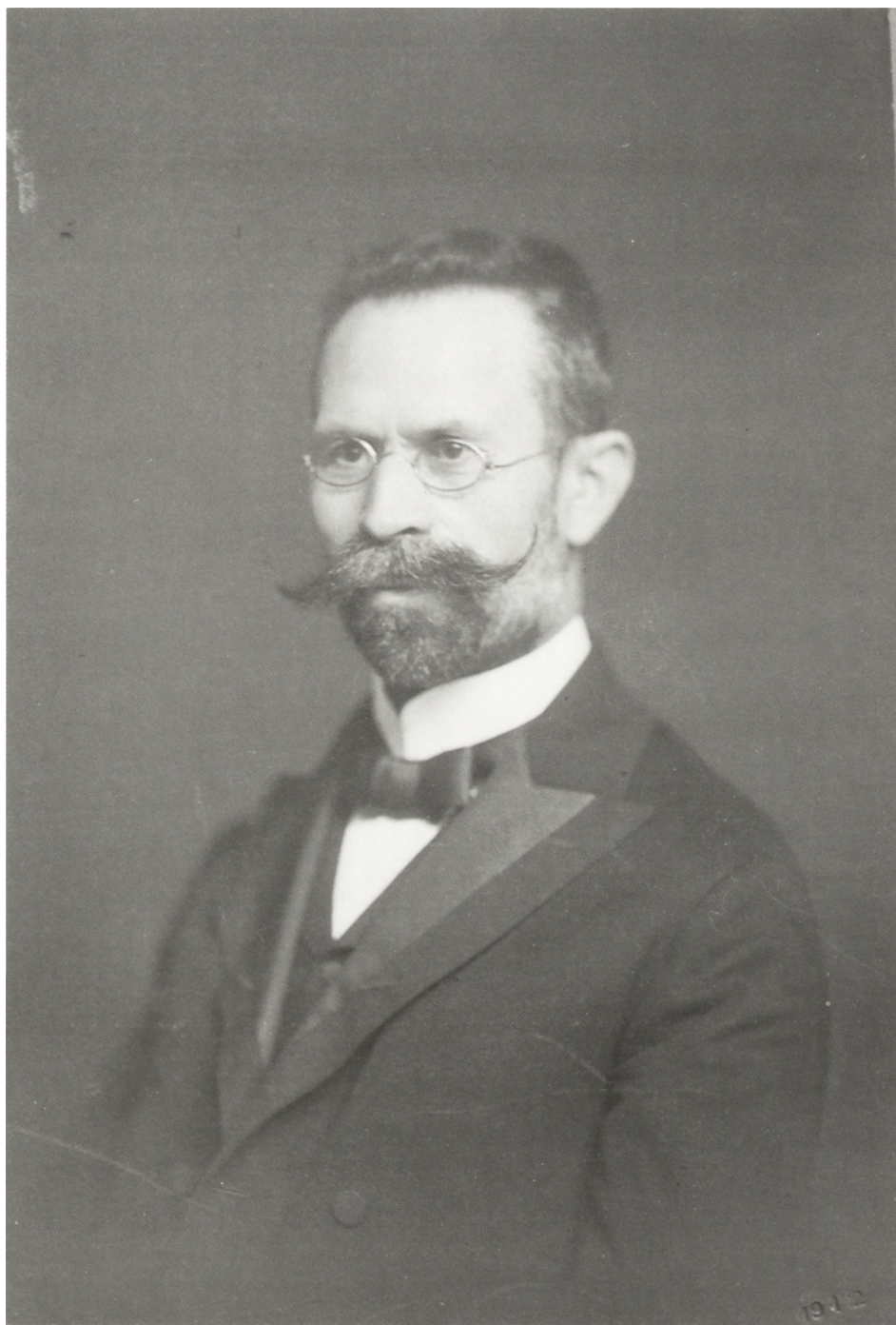
Fig. 4. Karel Kadlec (1868–1928)