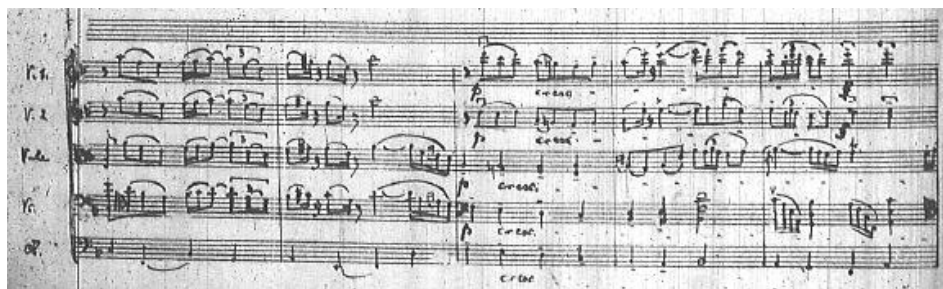
a) część I, końcowe takty pierwszego tematu w orkiestrze, takty 7–11.

Najbardziej wyrazisty jest główny temat I części. Oparty na skali d-moll eolskiej jednocześnie zawiera w pierwszym zdaniu kwartę lidyjską, która wpleciona w urywany pauzą szesnastkowy motyw nadaje melodyce odrobiny klimatu orientalnego. Silne podobieństwo melodyczne tematów, a przede wszystkim zastosowanie jedności tematycznej między I i III częścią stwarza sytuację spójności materiałowej wspomnianej powyżej bazy tematycznej.