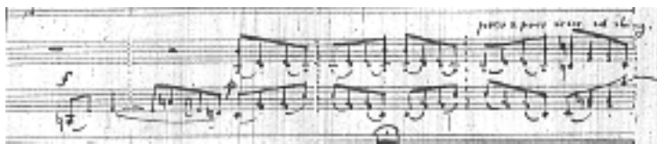
a) w partii fortepianu

Praca tematyczno-motywiczna, szeroko stosowana w omawianym utworze, polega na wyodrębnianiu fraz lub pojedynczych motywów, które są poddawane zabiegom przetworzeniowym, poprzez wielokrotne ich powtarzanie w różnych wariantach interwałowych, różnej oprawy instrumentalnej, i licznym transpozycjom. Z reguły w tych zabiegach motyw początkowy pozostaje bez zmian, kompozytor zachowuje tzw. „czołowość motywiczną” (w temacie A III części jest nim skok kwinty w górę i powtórzenie drugiej wysokości). Utworzony wariant frazy tematycznej staje się z kolei budulcem określonej fazy formalnej. Stała obecność motywów tematycznych w różnych konfiguracjach, lecz zawsze wyrażenie ukazanych, zapewnia Koncertowi d-moll nadrzędną substancjalną jedność, zróżnicowaną jednak w motywach cząstkowych. Multiplikacja melodycznych wątków odtematycznych jest jedną z głównych cech techniki kompozytorskiej Nowowiejskiego, zastosowaną w omawianym dziele.