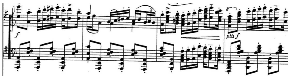
b) „temat obrzędów” w kodzie, takty 100–103.

Przykład 4. Feliks Nowowiejski, Korowody na cześć Łady .