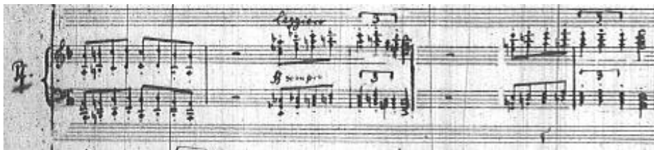
Przykład 14. Feliks Nowowiejski, Koncert fortepianowy d-moll , część I, takty 375–380.

Innym szczegółem harmonicznym o czysto kolorystycznym sensie są dodawane do akordów sekundy.