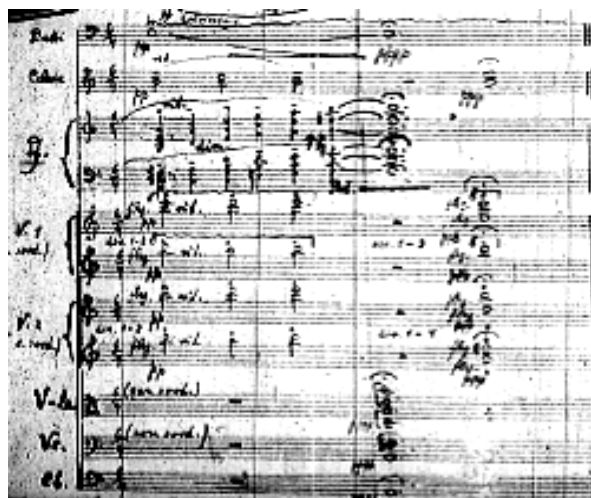
Przykład 10. Feliks Nowowiejski, Koncert fortepianowy d-moll , część II, końcowe takty: 200–201.

Ogniwo B, Andantino , wprowadza autocytat: materiał pierwszego utworu suitu Obrazy słowiańskie , przypomnijmy, zatytułowanego Poezja starego Krakowa , który został przeniesiony do II części Koncertu . Tworzy on w konstrukcji tej części drugi, nieco żywszy temat w partii fortepianu. Jego melodyka o rysunku falistym wyprowadzona jest z początkowego motywu. Temat podejmuje kwintet, fortepian dopełnia kontrapunktami, dochodząc do kulminacji stringendo . Po niej kompozytor dopowiada wątek poboczny ( poco meno mosso ), pokrewny tematowi B. W kolejnej odsłonie toku formy powraca motyw inicjalny tematu B w różnych wariantach. Poddany jest pracy motywicznej w partii fortepianu, a w końcowej fazie ogniwa powraca w jeszcze innym ukształtowaniu, ze zmianami melodycznymi. Część II kończy się bardzo oryginalną, kolorystyczną kadencją – dopełnieniem w postaci krótkiej kody Adagio z paralelnie przesuwanymi akordami oraz harmonicznym tłem flażoletowym smyczków.