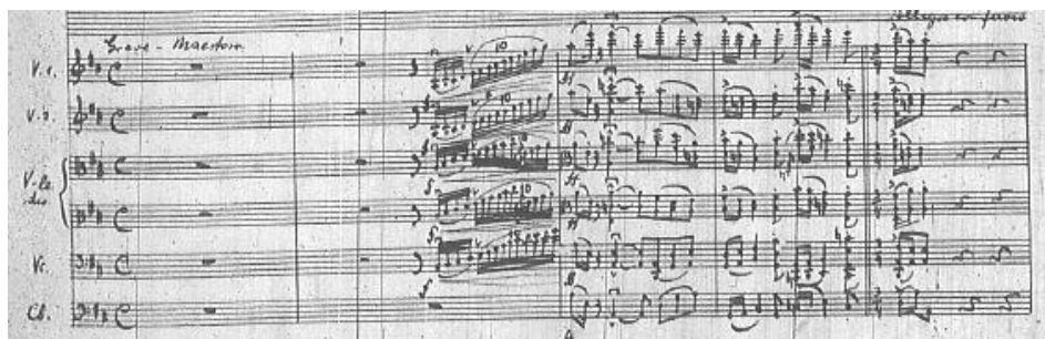
b) temat główny A III części w partii orkiestry, takty 1–5.

Przykład 11. Feliks Nowowiejski, Koncert fortepianowy d-moll .