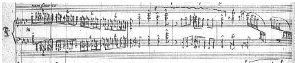
Przykład 8. Feliks Nowowiejski, Koncert fortepianowy d-moll , część I, fragment fortepianowej improwizacji w przetworzeniu, takty 158–162.

Patrząc całościowo na tę część, widzimy szeroko zakrojony poemat. Liczne powtórki fraz tematycznych zapewniają jednolitość materiałową i spójność narracji. Są one stale przeplatane improwizacyjnymi „wstawkami” odchodzącymi od materiału tematycznego. Zatem I część syntetyzuje formę sonatową ze swobodną fantazją, z silnymi akcentami wirtuozowskimi.