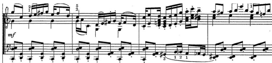
a) „temat obrzędów” w ogniwie B, takty 37–40.

Korowody na cześć Łady są zbudowane z 5 odcinków, powiązanych materia- łowo: ABCA 1 B 1 + koda. Otwierające ogniwo A ( Andantino ) z figuratywną, or- namentalną melodyką i prostą harmoniką rozwija się swobodnie, często wyko- rzystując ruch triolowy. To dźwiękowa inkarnacja samego bóstwa. Ogniwo B, wychodzące z miarowego rytmu ( Allegro risoluto ), przechodzące w zmienne figury, zdąża do właściwego tanecznego tematu, opartego na miarowym rytmie (charakterystyczne sekundy w akompaniamencie staccato ). Przedstawia tanecz- ne, korowodowe obrządki prymitywnego ludu („temat obrzędów”). Trzecie ogniwo – C ( Meno mosso ) – spowolnieniem narracji oddaje klimat guseł i za- klęć. Treści dwóch pierwszych ogniw powracają w nowych, rozbudowanych fakturalnie wersjach (np. B 1 podaje „temat obrzędów” z transpozycją o tercję i w zdwojeniach akordowych). Koda jest wirtuozowskim podsumowaniem utworu i ubraną w zdublowane pionie akordowe apoteozą „tematu obrzędów”.