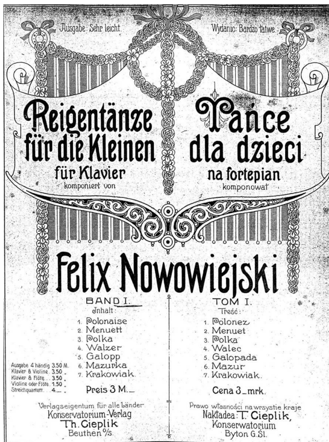
Przykład 1. Strona tytułowa Reigentänze für die Kleinen , wydanych przez wydawnictwo Konservatorium Thomasa Cieplika w Bytomiu 11

pieśni ludowej. Pozostałe utwory opiera na własnych pomysłach melodycznych, [...] charakteryzuje się nieskomplikowaną harmoniką, opartą na triadzie harmoniczej 10 .