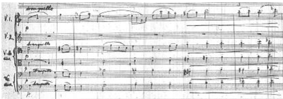
Przykład 9. Feliks Nowowiejski, Koncert fortepianowy d-moll , część II, temat ogniwa A, takty 14–18.

Ogniwo A, Adagio w tonacji A-dur, rozpoczyna się 9-taktowym wstępem solowym fortepianu w postaci melodycznego, lirycznego tematu z kontrapunktem dolnego głosu. Następuje zmiana tonacji na a-moll, w której grupa I skrzypiec intonuje nowy temat tranquillo , który jest właściwym tematem II części. Przyjmuje oprawę polifonizującą całego kwintetu, z techniką korespondencji motywicznej.