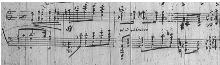
Przykład 3. Feliks Nowowiejski, Mazurek a-moll nr 4, takty 55–57.

W powyższym przykładzie interesującym „chwytym” stylizacyjnym jest „odwrócona” formuła akompaniująca, w której na pierwszą część taktu przypada struktura w wyższym rejestrze, a na drugą i trzecią miarę burdony kwintowe. Specyficzną jest również w fakturze fortepianowej ornamentyka w postaci drobnych figur pasażowych, często umiejscowiona pomiędzy strukturami akordowymi. Struktury akordów posiadają następną właściwość idiomatyczną – w postaci dodawanych sekund w funkcji kolorystycznej (por. przykład 2), a w organizacji przebiegów harmonicznycy technika paralelnych przesunięć: