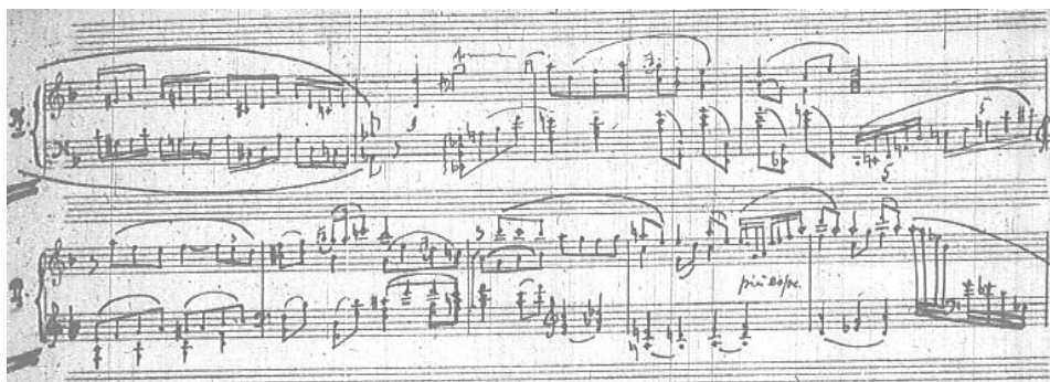
Przykład 6. Feliks Nowowiejski, Koncert fortepianowy d-moll , część I, pierwszy temat w partii fortepianu, takty 23–31.

Ekspozycję otwiera potężne 4-taktowe tutti orkiestrowe na akordzie A-dur, utrzymanym w długich wartościach. Po nim kwintet smyczkowy intonuje główny temat. W rysunku melodycznym jest on prosty, epicki w charakterze, posługuje się postęпами drobnointerwałowymi. Towarzyszy mu warstwa kontrapunktująca w grupie dętej. Rozwinięty do kulminacji wprowadza partię solową. Fortepian wstępuje z krótką kadencją, powtarzającą ten sam, co we wstępie orkiestry szereg akordów i oktaw. Figuracyjny łącznik prowadzi do solistycznej prezentacji tematu w odmiennym, parafrazującym ujęciu w fakturze polifonizującej.