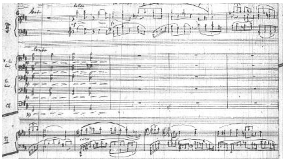
Przykład 7. Feliks Nowowiejski, Koncert fortepianowy d-moll , część I, drugi temat w partii fortepianu, takty 82–91.

Przetworzenie właściwe rozpoczyna się po krótkiej, solowej sekwencji fortepianu. Początkowo „oddaje głos” smyczkom, kontynuującym motywikę tematu drugiego w rozdzielonych partiach divisi . Zasada pracy przetworzeniowej pozostaje ta sama, co w ekspozycji: wielokrotne projekcje fraz lub pojedynczych motywów, z niewielkimi zmianami interwałowymi. Prowadzone są przez instrumenty orkiestry, dopełniane planem figuracyjnym fortepianu (częsta technika oktafowa w wysokim rejestrze). W końcowej fazie przetworzenia grupa dęta intonuje nowy, marszowy temat, a po nim przeplatają się jeszcze przekształcone motywy pierwszego tematu.