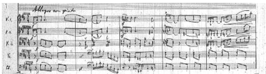
b) otwierający 8 fazę części III

Przykład 13. Feliks Nowowiejski, Koncert fortepianowy d-moll , temat A części III i jego dwa warianty