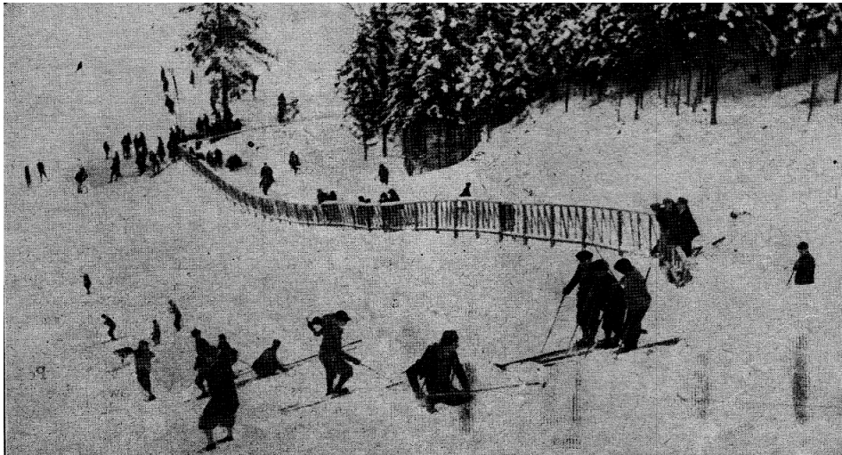
Fot. 3. Lipki k. Zakopanego, na niewielkiej skoczni śnieżnej leży jeden z uczestników amatorskich skoków na nartach; źródło: „Stadjon” 1927, nr 3, s. 10.