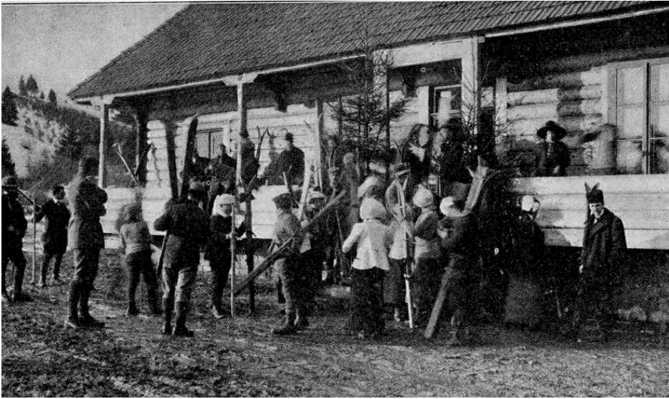
Fot. 2. 1913 r. uczestnicy kursu narciarskiego w Sławsku przed wyjściem na zajęcia