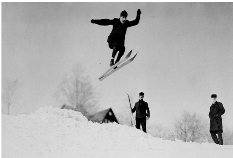
Fot. 4. Początki skoków na ziemiach polskich, na terenowej skoczni ze śniegu

Źródło: Z. Pręgowski, Dzieje narciarstwa polskiego do 1914 r. , Warszawa 1994, A. Fredro-Boniecki, Historia narciarstwa polskiego 1907–1914, Zestawienie ważniejszych zawodów z okresu do 1914 r. , „Narciarstwo Polskie” 1925, t. 1, s. 58–62.