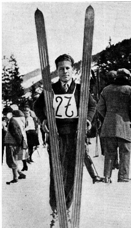
Fot. 7. Stanisław Marusarz najlepszy polski skoczek narciarski w okresie 20-lecia międzywojennego

Za najlepszego skoczka w okresie 20-lecia międzywojennego należy uznać Stanisława Marusarza (1913–1993). Przemawiają za tym jego sukcesy, m.in. mistrzostwo Polski w: 1932 r., 1933 r., 1935 r. 1936 r., 1937 r. i 1939 r. Czterokrotnie ustanawiał rekord Polski w skokach (w 1931 r. w Ponte di Legano – 74 m, w 1935 r. w Planicy – 87,5, 93 i 97 m), a także pięciokrotnie ustanowił rekord odległości skoczni na Krokwi, m.in. w: 1932 r. – 72 m, 1934 r. – 74 m, 1938 r. – 76,5 m. W omawianym czasie Stanisław Marusarz był wicemistrzem świata w skokach w 1938 r. i dwukrotnie uczestniczył w Igrzyskach Olimpijskich w Lake Placid 1932 r. oraz w Garmisch Partenkirchen w 1936 r. Za swoje sukcesy w 1938 r. został laureatem Wielkiej Honorowej Nagrody Sportowej, a także, w tym samym roku, zwyciężył w Plebiscycie Przeglądu Sportowego.