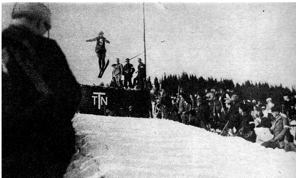
Fot. 5. 1911 r. skoki na skoczni narciarskiej TTN na Kalatówkach; źródło: J. Kapeniak, Tatrzańskie diabły, W starym obiektywie (serwis fotograficzny) , Warszawa 1971.

Po powołaniu w 1919 r. Polskiego Związku Narciarskiego (PZN) pierwsze dwa lata zarząd poświęcił na działania związane z budową wewnętrznych struktur związku oraz na upowszechnianie narciarstwa wśród społeczeństwa polskiego. Osiągnięciem PZN było opracowanie i nowelizacja statutu, zorganizowanie Związkowych Narciarskich Mistrzostw Polski oraz udostępnienie skoczni narciarskich w Zakopanem na Jaworzynce, w Sławsku, Krakowie i Bielsku. W pierwszych pięciu latach istnienia PZN swoją działalność prowadził w oparciu o składki członkowskie, dochody z imprez narciarskich oraz z subwencji państwowych. Wraz z rozwojem biegów narciarskich niezależnie rozwijały się skoki narciarskie. Wcześniej, bo już w 1920 r., z inicjatywy działaczy SNPTT w Zakopanem oddano do użytku większą skocznię narciarską w Dolinie Jaworzynki pod Zakopanem, a w następnych latach skocznie powstawały w Krakowie, Lwowie, Sławsku i w Worochcie.