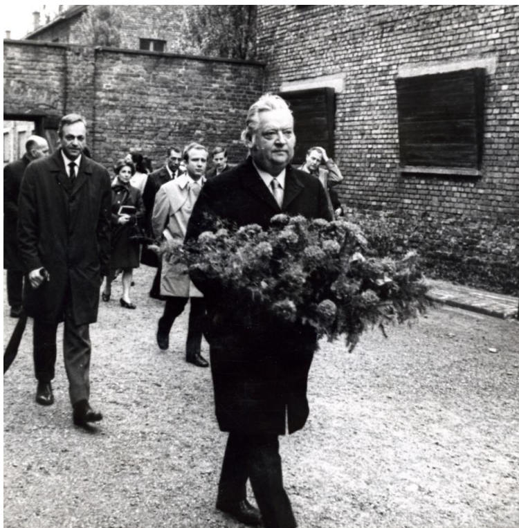
Fot. 5. Lord Killanin w niemieckim obozie koncentracyjnym Auschwitz, 1974 r.

Wszystkie te postanowienia – zarówno z Kongresu, jak i wiedeńskiej sesji MKOl – zrywały z pryncypiami Brundage’a, które realizowano w okresie jego prezydentury. Tym niemniej, na realizację wielu zgłoszonych tam słusznych postulatów, szczególnie związanych ze znacznymi wydatkami, musiano zaczekać do kolejnej prezydentury – Juana Antonia Samarancha 25 .