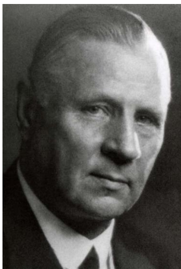
Fot. 3. Johannes Sigfrid Edström

bliki Federalnej Niemiec powołany został jego NKOl, na czele którego niebawem stanął Karl Ritter von Halt, a sekretarzem generalnym został Carl Diem 13 .