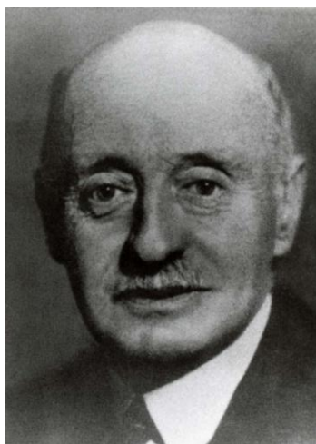
Fot. 2. Hrabia Henri de Baillet-Latour

Coraz bardziej napięta sytuacja międzynarodowa w końcu lat 30. XX wieku odcisnęła swoje piętno również na działalności Międzynarodowego Komitetu Olimpijskiego. Ostatnie sesje MKOl w Warszawie w 1937 r., Kairze w 1938 r. i Londynie w 1939 r. przyniosły istotne zmiany w składzie osobowym komitetu – zasadniczemu wzmocnieniu uległa reprezentacja państw Osi reprezentowanych już przez 10 członków, w tym trzech Niemców (na ogólną liczbę 72 członków) 7 . Ponadto eksponowane miejsca w komitecie zajmowały osoby niezwykle przychylnie dyktaturze nazistowskich Niemiec, jak Amerykanin Avery Brundage (1887–1975). Długoletniemu przewodniczącemu MKOl hr. Henriemu de Baillet-Latour (1876–1942) coraz trudniej było utrzymać linię swojego wielkiego poprzednika, wskrzesiciela nowożytnych igrzysk olimpijskich barona Pierre’a de Coubertina (1863–1937). Wybuch II wojny światowej uniemożliwił przeprowadzenie kolejnych igrzysk olimpijskich w 1940 i 1944 r.