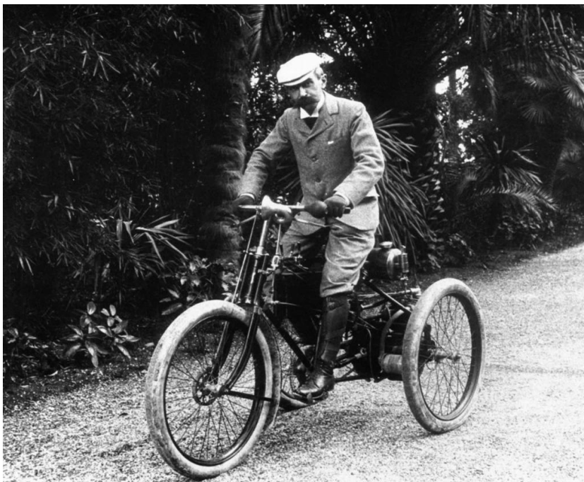
Fot. 1. Baron Pierre de Coubertin, 1920 r.

formacji i opinii można odnaleźć również w opublikowanych wspomnieniach niektórych przewodniczących MKOl 4 . Dużą wartość poznawczą w zakresie działalności przewodniczących MKOl mają opracowania Davida Millera 5 . Nie można pominąć w tym skróconym zestawieniu literatury dziennikarskich ustaleń Andrew Jenningsa, uparcie tropiącego przejawy korupcji na wielką skalę w łonie MKOl i międzynarodowych federacji sportowych 6 .