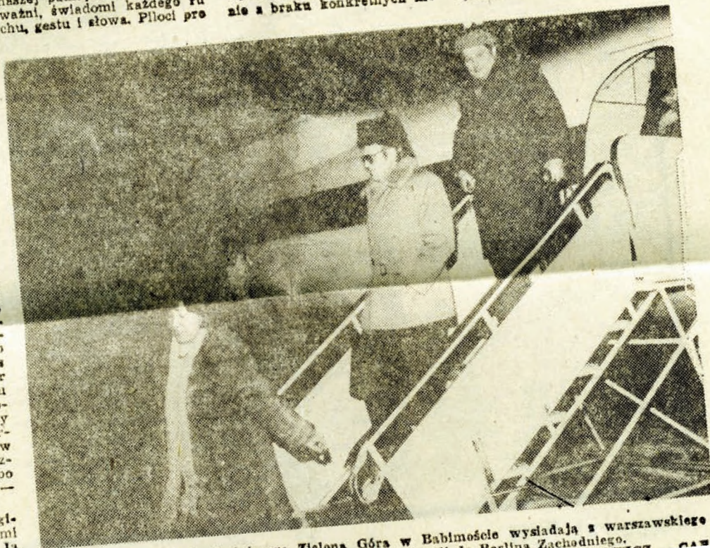
Na płycie Portu Lotniczego Zielona Góra w Babimoście wysiadają z warszawskiego samolotu pasażerowie, którzy 4 bm. uprowadzeni byli do Berlina Zachodniego.

Propozycje pozostania w Berlinie Zachodnim, o których mówili pasażerowie usłyszani w rozmowie z dziennikarzem „GL”, stawiane przez funkcjonariuszy policji kryminal-