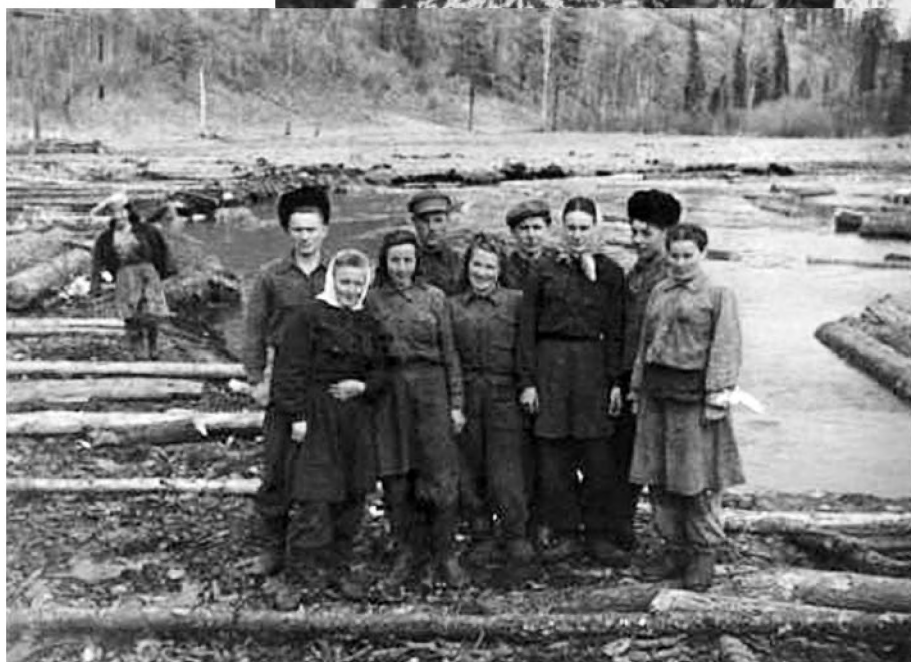
Syberia, splaw drewna