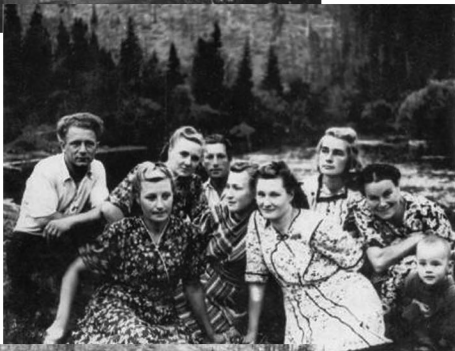
Kobiety nad Kolbą