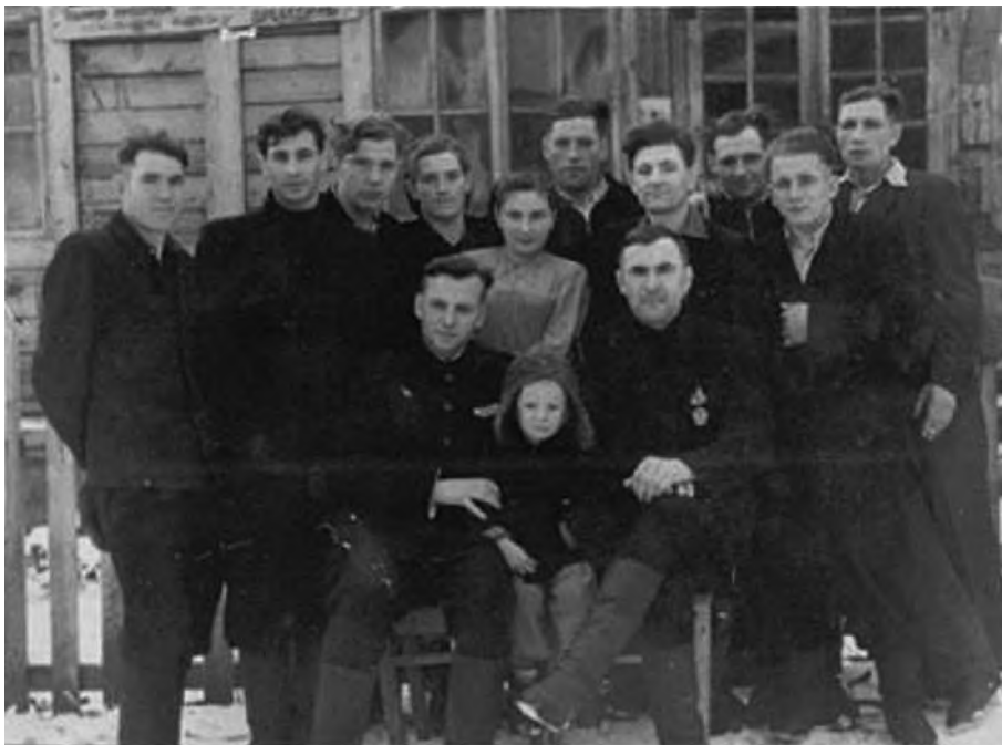
Lespromchoz w Murtuku

– To się zdarza, może pan dalej mówić po rosyjsku.