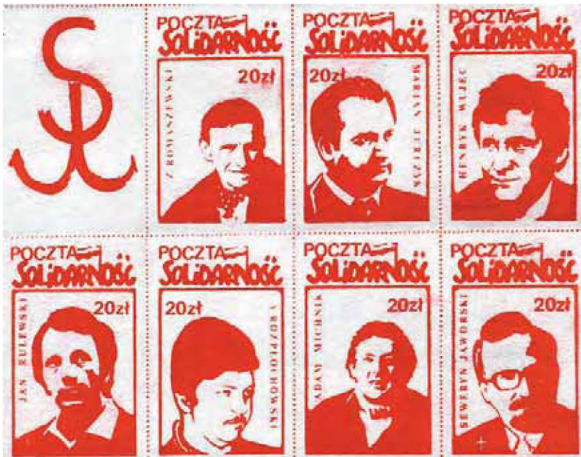
Fragment kolekcji Zenona Szendo – działacza opozycji antykomunistycznej w regionie łódzkim