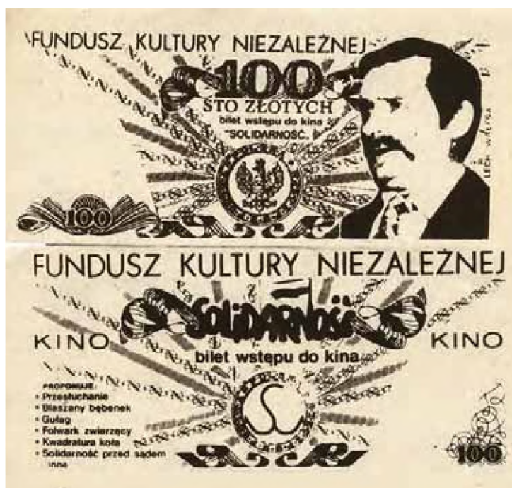
Fragment kolekcji Zenona Szendo – działacza opozycji antykomunistycznej w regionie łódzkim (AIPN Łd, 237/19)