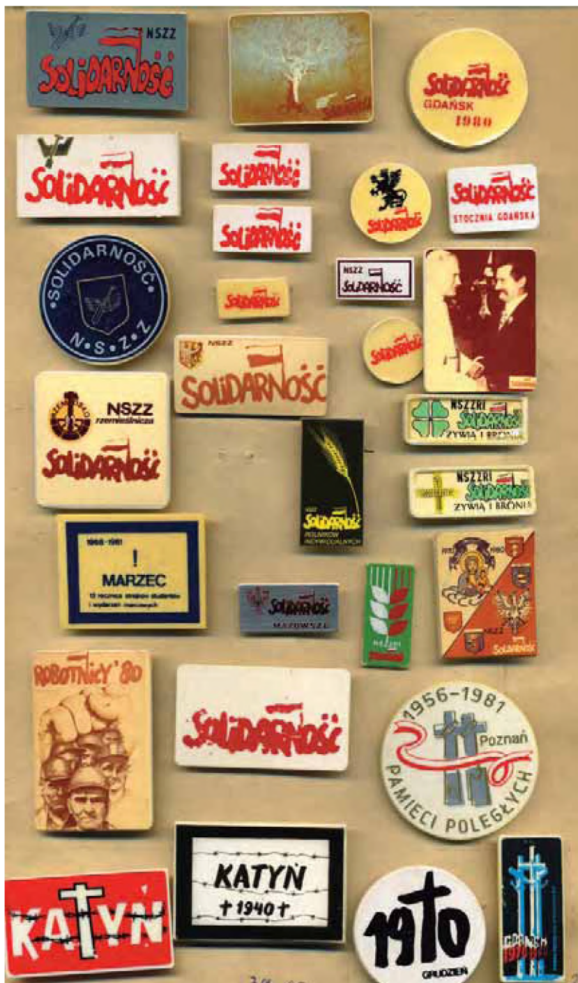
Fragment kolekcji Zenona Szendo – działacza opozycji antykomunistycznej w regionie łódzkim (AIPN Łd, 237/18)