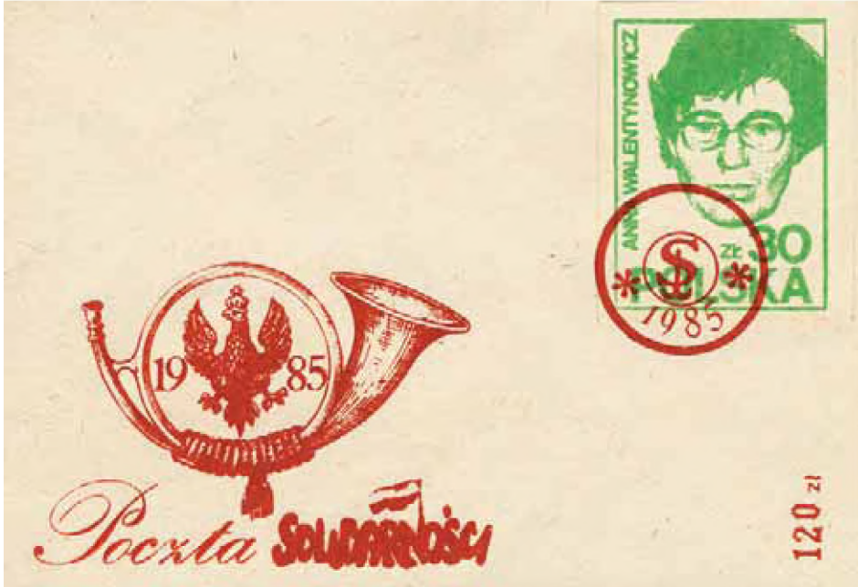
Fragment kolekcji Zenona Szendo – działacza opozycji antykomunistycznej w regionie łódzkim (AIPN Łd, 237/19)