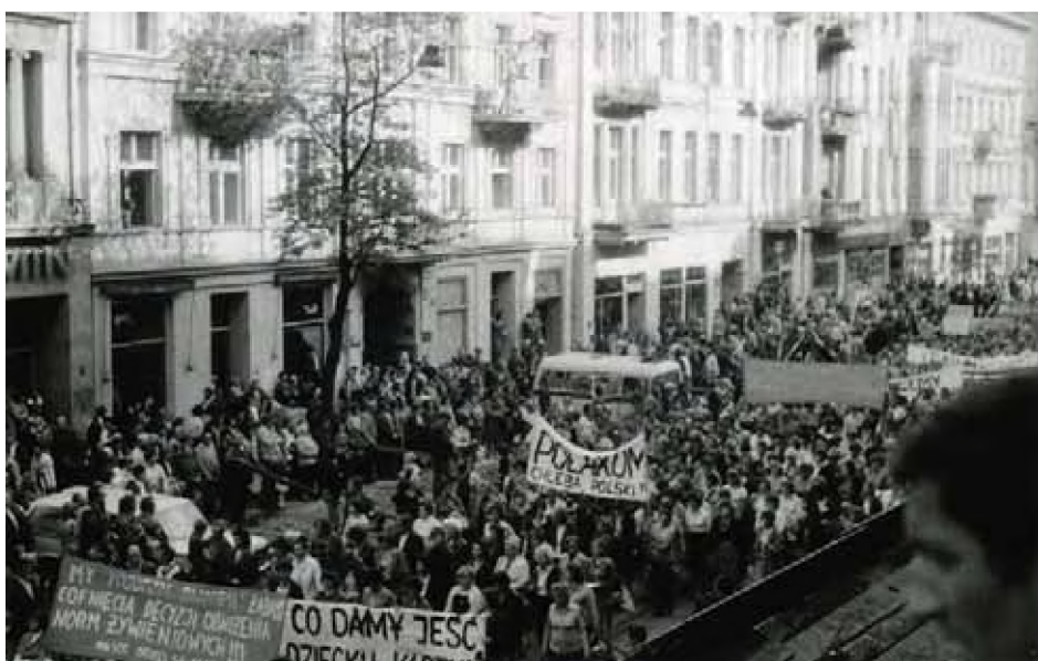
Marsz głodowy w Łodzi zorganizowany przez ZR NSZZ „Solidarność” Ziemi Łódzkiej 30 lipca 1981 r.