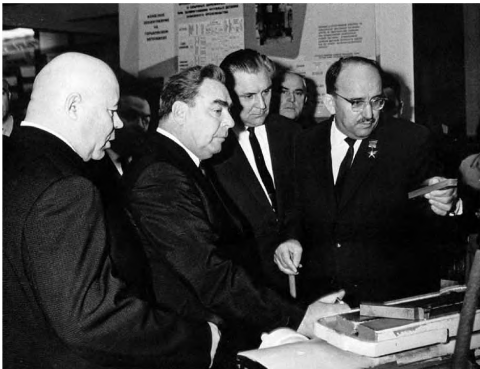
Od lewej: P. Szelest, L. Breżniew i W. Szczerbyćkyj (lata sześćdziesiąte XX w.)