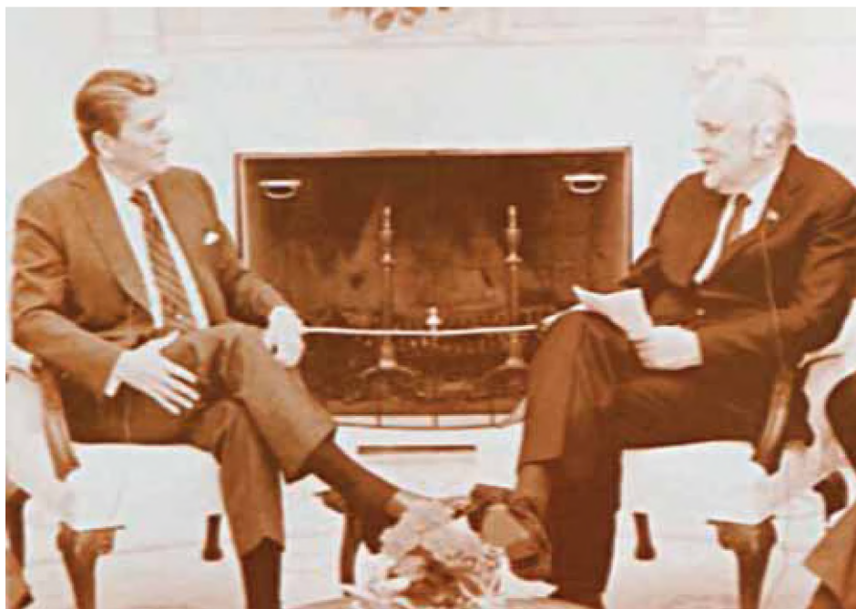
Spotkanie R. Reagana i W. Szcerbyčkiego (Waszyngton, 1985 r.)