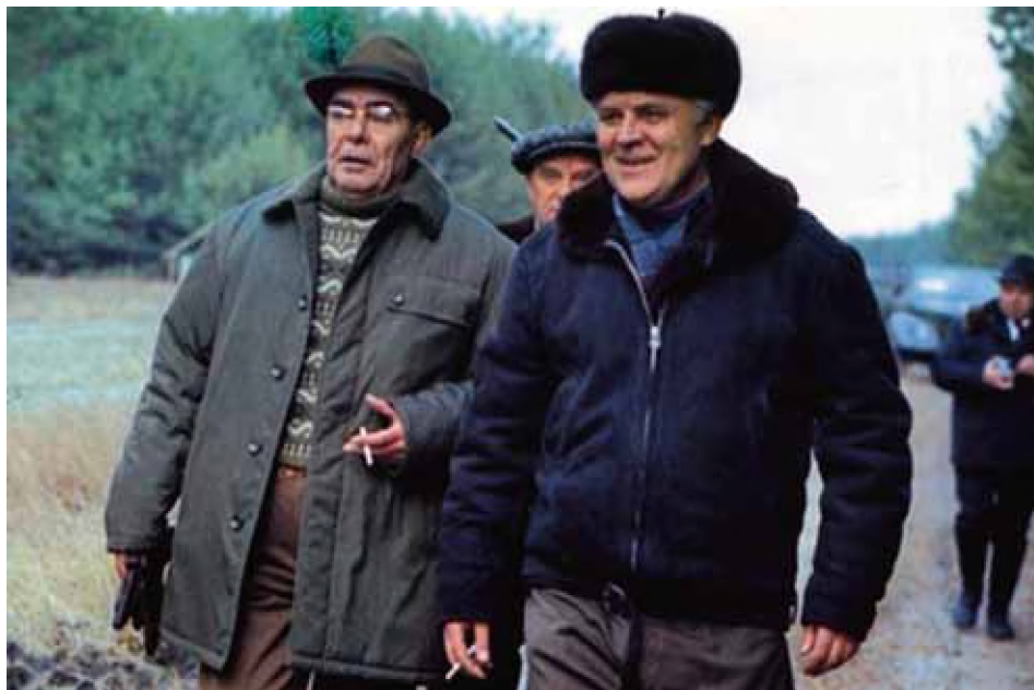
L. Breżniew i W. Szcerbyčkyj podczas polowania pod Kijowem (1976 r.)