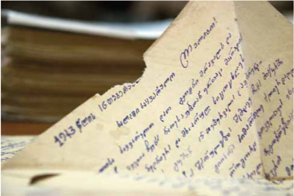
List z miejsca przesiedlenia