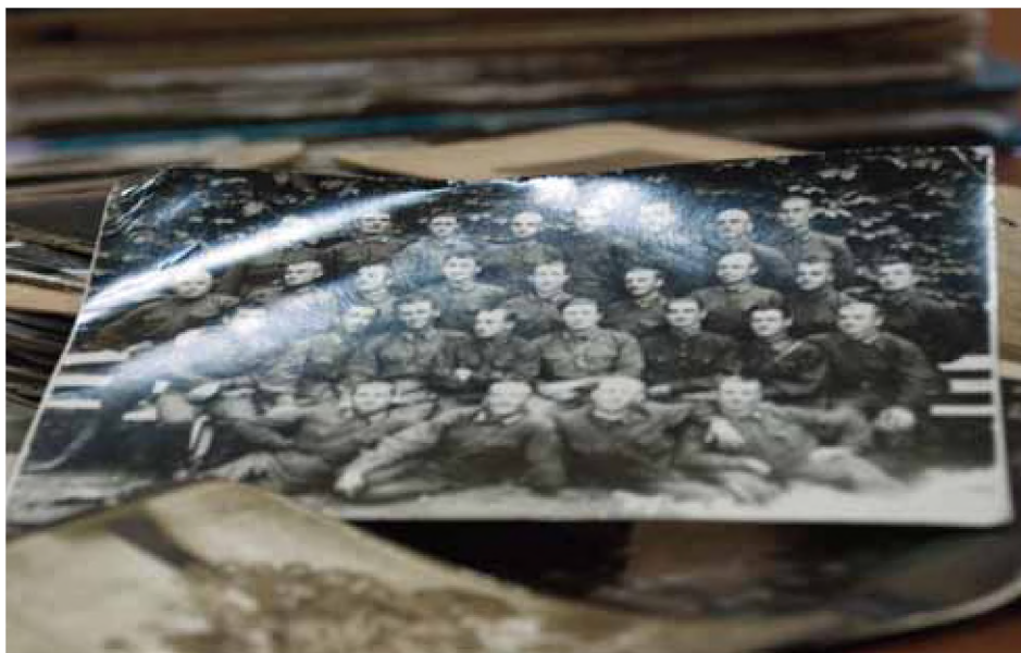
Fotografia pracowników NKWD

Key words: Archives of the Ministry of Internal Affairs of Georgia, Archives of the State Security of Georgia, Archives of the Soviet Police of Georgia, Archives of the Communist Party of the Georgian Soviet Socialist Republic.