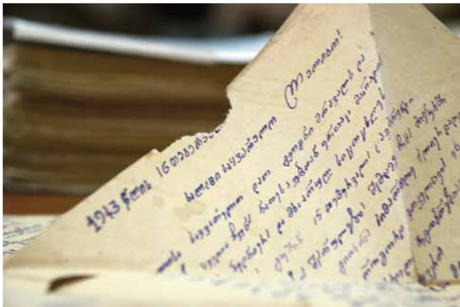
List z miejsca przesiedlenia (Archiwum MSW Gruzji)