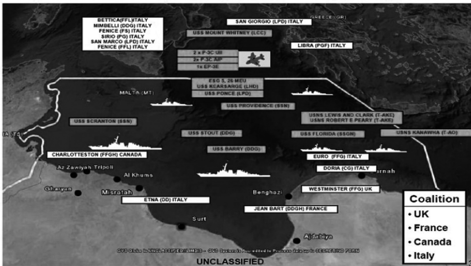
Mapa 2. Siły Koalicji Chętnych i ich rozmieszczenie