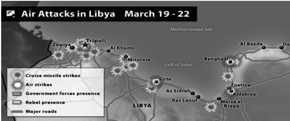
Mapa 1. Obszar walk pomiędzy siłami rebeliantów i armią Kadafeigo