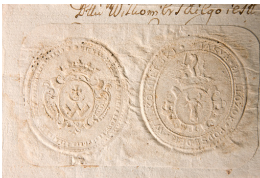
Il. 4. 1731 r., wypis z ksiąg wilkomierskiego sądu ziemskiego z pieczęciami sędziego i podsędka; B. Uniwersytetu Wileńskiego, RS, f. 5-A28-4975