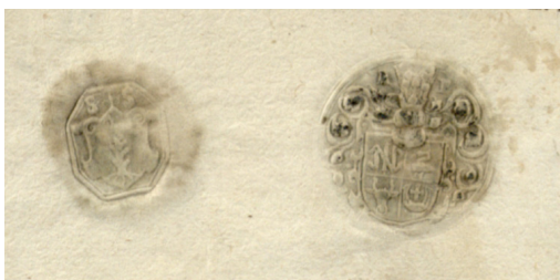
Il. 2. 1586 r., wypis z ksiąg oszmiańskiego sądu ziemskiego z pieczęciami sędziego i podsędka; B. Wróblewskich, RS, f. 16–77, k. 150