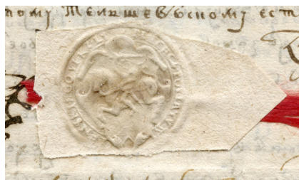
Il. 1. 1604 r., wypis z sądu Trybunału Głównego WKL w Wilnie z pieczęcią wileńskiego sądu ziemskiego; B. Wróblewskich, RS, f. 16–92, k. 74